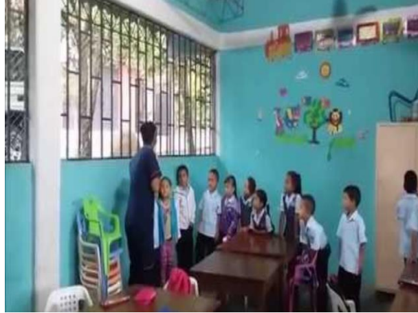
Fotografía 25 Actividad teléfono Averiado.

En esta semana cumpliendo las actividades del teléfono averiado para la cual se desarrolló la temática de textos en trozos de papel que los alumnos deberían de sacar de un bote plástico para posteriormente leer y transmitir la información al compañero siguiente de forma secuencial el propósito fue el de lograr