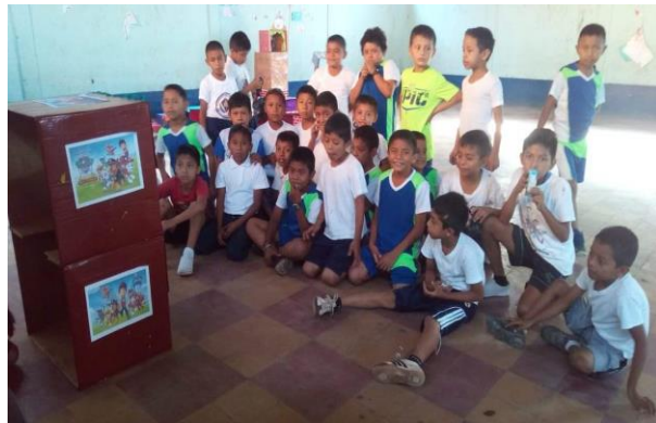
Fotografía 26 Alumnos observando la cartelera.

En esta semana continuando con el proceso del proyecto de mejoramiento educativo se realizó la temática del observador para ello se presentó a los alumnos una cartelera de lectura a la cual ellos se dirigían a observar optando así a la motivación de leer con esta actividad se logró que los alumnos se motivaran a través de las carteleras y se volvieran observadores latentes en el proceso de la lectura.