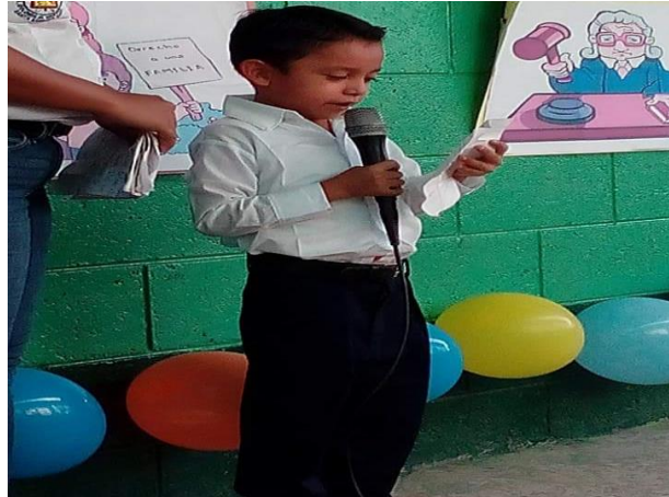
Fotografía 15 alumno leyendo carta ante el público presente.

Continuando durante esta semana se encontraba la actividad de la lectura a la carta para lo cual se motivó a los estudiantes a que estructuraran la carta dirigida a la persona que ellos decidieran con el fin de que el día del acto cívico pasarían al frente a leer la carta ganadora motivando así al desplazamiento de la fluidez lectora y sobre todo a la pérdida de la debilidad de la falta de agilidad y comprensión a lo que se lee.