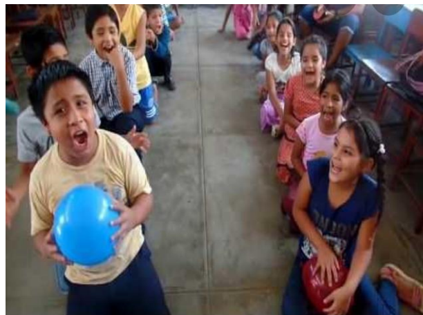
Fotografía 20 Técnica el globo

En esta semana correspondió la actividad de la lectura de la dinámica del globo introduciendo un texto de lectura en cada uno solicitándole al estudiante que debería de inflarlo y luego reventar y al momento de explotar saldría el trozo de papel al cual debería de darle lectura con esto se logró la motivación lectora, la comprensión