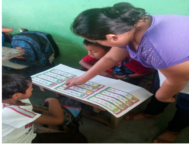
Fotografía 23 Leyendo con mi maestra.

Continuando con las actividades del cronograma se siguió proporcionando material a los estudiantes para que continuamente lograra seguir motivando con las estrategias lectoras en esta actividad se proporcionó materiales a los alumnos y se les guio al proceso de leer conjuntamente con la docente siendo así que se rompió el desafío de leer y practicar en clase.