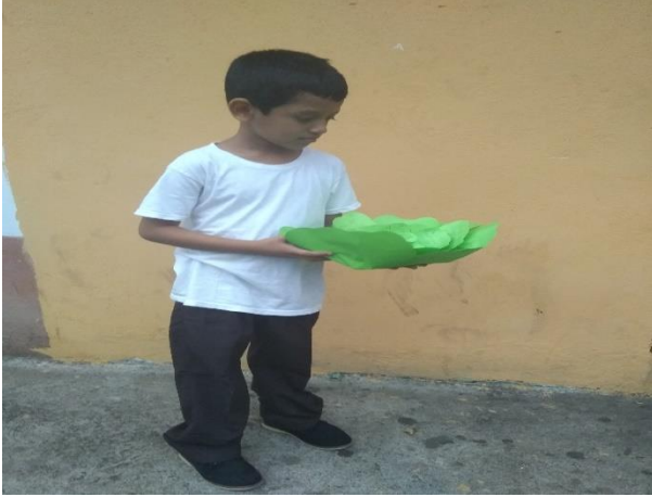
Fotografía 10 Técnica Repollo Preguntón.

Seguidamente para continuar con la semana laboral se les presento a los estudiantes un cuento para que ellos desarrollaran el desenlace del mismo tomando como marco de referencia la actividad que estaba plasmada en el cronograma como el desarrollo de actividades de la comprensión lectora, implementando la siguiente estrategia, el docente le da lectura al cuento hasta la parte descriptiva del nudo. Los