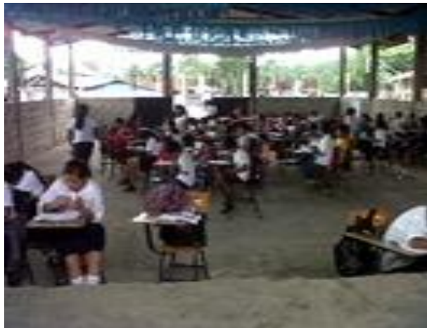
Fotografía 16 Alumnos/as en el salón de uso múltiple.

Para esta actividad se llevó a los estudiantes al salón de usos múltiples de la escuelita con el propósito de no afectar a los docentes al momento de realizar la actividad se utilizó la gabacha para contar un cuento y que ellos emitieran los sonidos y las pronunciaciones correctas lo más fuerte que pudieran tomando en cuenta que luego serían ellos quienes de forma grupal contarían su propio cuento a los compañeros.