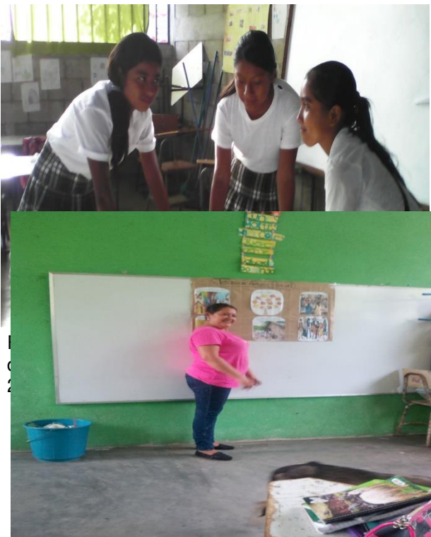
Fotografía 11 Charla Motivacional a los alumnos de tercero primaria sección "B".

estudiantes en forma grupal deberían de crear su propia idea de desenlace o final con el objetivo de que pasaran al frente a leerlo bajo sus propios criterios e ideas desarrollando así el hábito de la lectura.