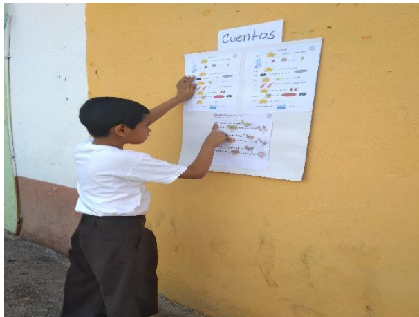
Fotografía 22 Alumno leyendo cuento.

Esta semana fue una semana muy agradable fue una de las semanas que mayor satisfacción se logró con la presentación de cuentos siendo así se presentó el cuento 1 y el cuento 2 para la comprensión motivacional y el desarrollo analítico a través de la lectura para ello se utilizaron los trajes