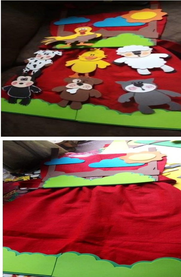
Fotografía No. 8 Realización de material.