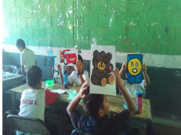
Fotografía 13 Alumnos dibujando los actores del cuento que el docente les narro.

poder visualizar los actores del cuento para que al finalizar la actividad buscaran un espacio que más les agradara y dibujaran lo que habían retenido de la fuga de los dibujos el objetivo era enseñarles a leer correctamente separando los puntos y las comas de la lectura así como dar la acentuación correcta y la pronunciación.