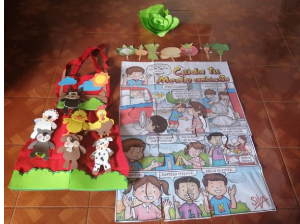
Fotografía 29 Materiales que se elaboraron.