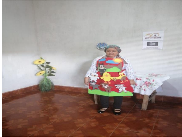
Fotografía 27 Forma de utilizar la gabacha.

Para esta actividad se desarrollará la grabación de un video haciendo énfasis en la temática de la técnica la gabacha tomando en cuenta el objetivo de dar a conocer como el maestro/a puede trabajar una clase utilizando la técnica de la gabacha acoplado a la lectura seguidamente se agregó la