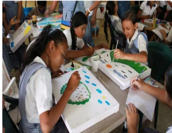
Fotografía 24 Alumnas dibujando.

Continuando con el proceso de estrategias lectoras se realizaron las lecturas con imágenes para la cual se solicitó a los alumnos dibujar su propia imagen que les permitiera así dirigir su lectura a través de la imagen que iban realizando lectura que ellos crearían en su cuaderno y la asociarían con la imagen despertando así el mayor interés al desarrollo lector.