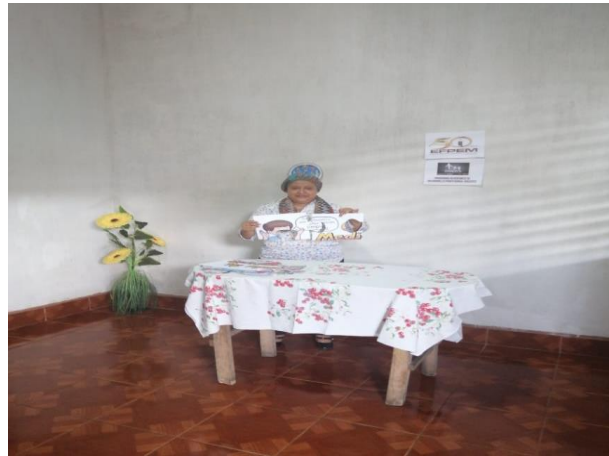
Fotografía 28 Indicaciones de como armar el rompecabeza.

Para la segunda actividad emergente se grabó un video enfocado a la técnica de la historieta y el rompecabezas en el cual se demostró como el maestro o maestra puede despertar el interés a los alumnos con la lectura a través de la historieta