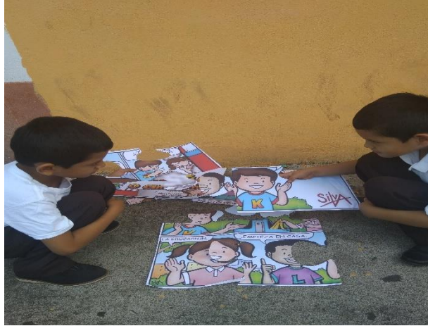
Fotografía 21 Armando el rompecabezas.

Seguidamente en estas actividades se desarrolló la actividad armando nuestro propio rompecabezas de lectura para lo cual se formaron los estudiantes en pareja y se les proporciono un rompecabezas que contenía una historieta apropiada a su nivel con el fin de despertar el interés en el proceso del desarrollo de la