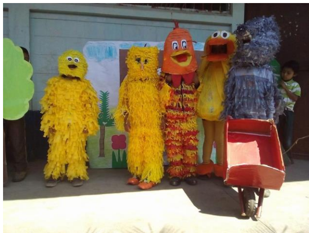
Fotografía 7 Trajes elaborados.