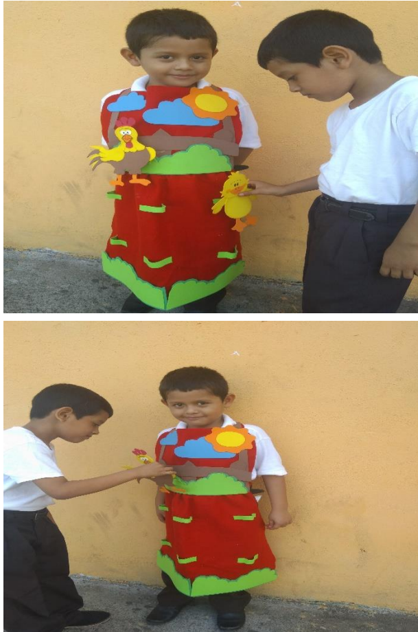
Fotografía 19 Alumnos utilizando técnica la gabacha.

Continuamente se desarrollo la actividad de presentación utilizando una gabacha creativa en esta actividad se les proporciono una gabacha a los estudiantes para que en parejas leerán una historia y utilizaran la gabacha con su respectivo desarrollo con figuras de paleteros logrando así el análisis reflectivo de la lectura.