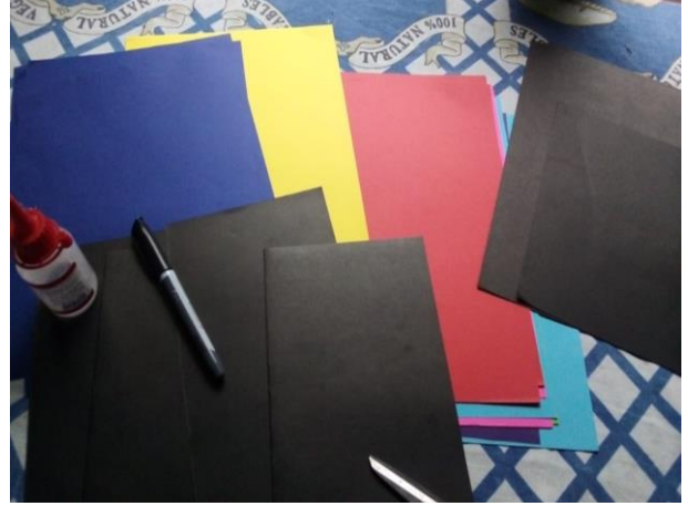
Fotografía 6 Materiales a utilizar.

Durante esta fase se realizaron algunos trajes que se utilizarían para las lecturas de cuentos a desarrollar con los estudiantes tomando en cuenta que la comunidad es de escasos recursos se realizaron rifas para cubrir los gastos que conllevaría la actividad para la cual se adjunta la imagen de los trajes elaborados.