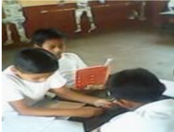
Fotografía 17 Alumnos leyendo

Durante esta semana basándose al cronograma de actividades utilizando los materiales que se habían embodegado y se les proporciono a los estudiantes para que iniciaran la elaboración del recurso que necesitarían para la presentación de los cuentos y sus lecturas todo esto con el fin de continuar el proceso de la motivación para el desarrollo de la lectura como parte de las estrategias.