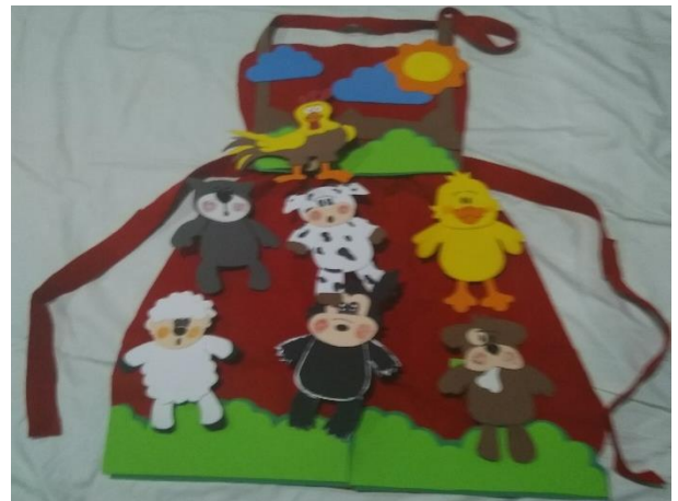
Fotografía 3 Material entregado al director del establecimiento (La Gabacha)

Fotografía 2 Carta de solicitud de permiso para desarrollar el PME presentada al establecimiento Fuente: Elaboración propia 2020