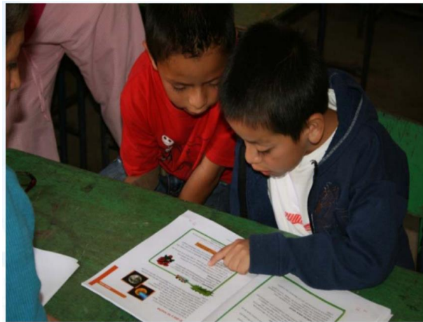
Fotografía 14 Alumnos motivados por la lectura Fuente: Elaboración propia 2020