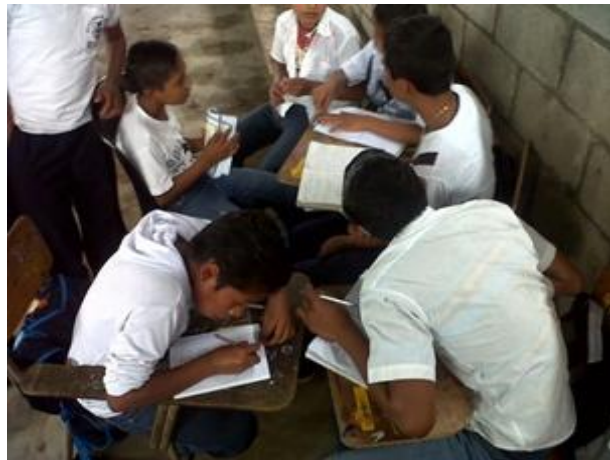
Fotografía 18 Alumnos escribiendo.

Durante esta semana se continuó trabajando durante el proceso de crear con los estudiantes la estructura de su propio cuento proporcionando así a ellos libros de cuentos para que se pudieran apoyar como marco de referencia para la elaboración de sus propios cuentos en esta actividad se logró que ellos leerán varios