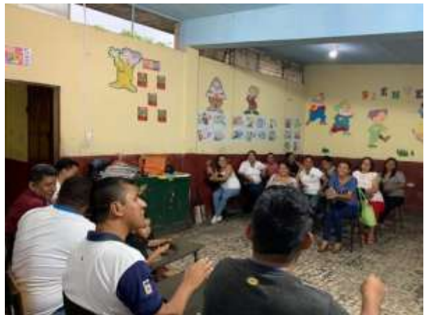
Fotografía 5: Socialización con docentes

Se convocó a una reunión en horario oportuno a los docentes para darles a conocer las generalidades del Proyecto de Mejoramiento Educativo.