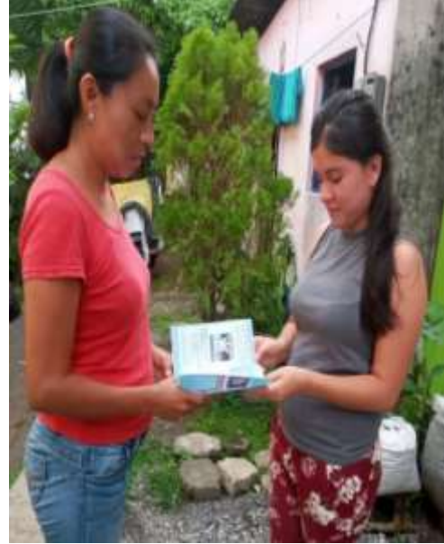
Fotografía 1: Entrega de tríptico

Los trípticos fueron elaborados a computadora en el programa Word e impresos en hojas de papel bond tamaño carta, conteniendo información de manera sintetizada y de fácil comprensión para el lector e ilustrados, fueron entregados a la población en lugares céntricos y concurridos del municipio de Patulul, Suchitepéquez.