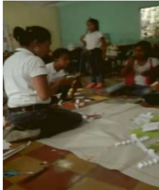
Fotografía 7: Elaboración mural de lectura

no sabía leer. No se trata que otras actividades no funcionen, todas son útiles y como todo tiene ventajas y desventajas pero se eligió desde redactar oraciones por medio de un troquelado ya que de esta manera van leyendo y a su vez están escribiendo, de igual forma, leen al presentar de manera teatral los textos, cuentos o historias, es motivante para ellos y se van involucrando en el objetivo que es la lectura y mejorar su fluidez verbal.