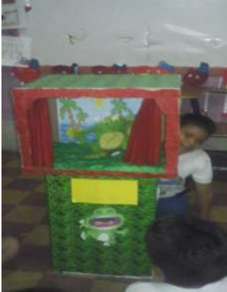
Fotografía 12: Ejecución de cuentos