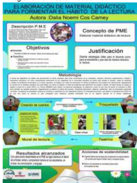
Fotografía 15: Póster Académico

La divulgación del Proyecto de Mejoramiento Educativo a las autoridades del Programa Académico de Desarrollo Profesional Docente se hizo por medio de un Poster Académico. Para la elaboración del Póster se utilizó el programa Word, además, de seleccionar información y fotografías que ayudaran a una mejor comprensión del mismo. En el Póster se pudo apreciar información relativa al nombre del Proyecto, la naturaleza, objetivos, actividades desarrolladas, resultados, entre otros.