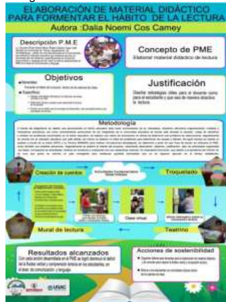
Fotografía 16: Instrumento de evaluación