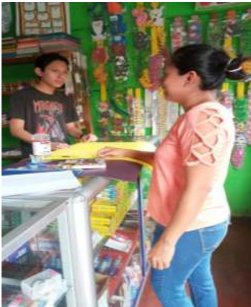
Fotografía 8: materiales de librería