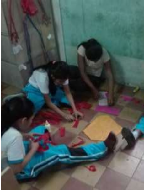
Fotografía 10: Elaboración troquelado