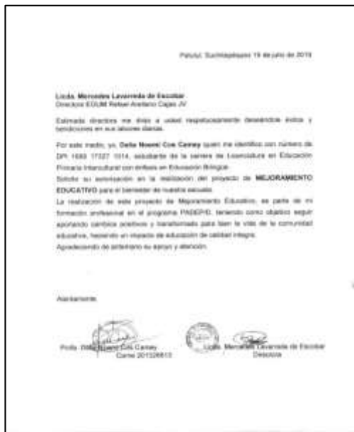
Fotografía 4: Solicitud directora