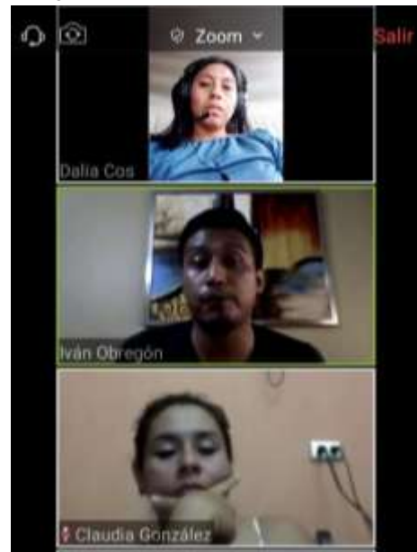
Fotografía 14: Clase virtual

Además, se dio por parte del asesor, las orientaciones necesarias para elaborar los Capítulos III y IV del informe, así como de las partes preliminares y sustantivas del informe. Lo anterior se llevó a cabo durante el mes de mayo, en clases virtuales, a través de la plataforma ZOOM, los días jueves y sábados.