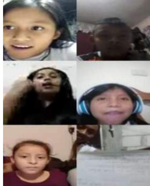
Fotografía 3: Clase virtual

La clase virtual consistió en interactuar con estudiantes de tercer grado de primaria y realizar la actividad “Rastreo de palabras” en donde se les presentó un texto en un cartel y en 15 segundos tomando en cuenta el tiempo debieron leer tres palabras. Al concluir el tiempo buscaron en otros 15 segundos las palabras en el texto, con el fin de practicar la lectura rápida con la actividad se evidenció que de forma de juego el estudiante se interesa en la lectura y en la cual participó un niño que en clase ha sido lento en la lectura, pero en esta actividad se logró una lectura rápida en él.