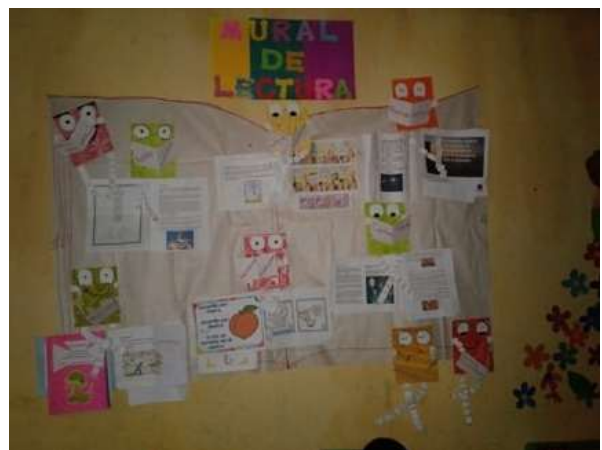
Fotografía 13: Presentación del mural de lectura

En esta actividad cada grupo clasificó tipos de lectura según lo que indica el Curriculum Nacional Base para el grado de tercero primaria. Se logró atraer la atención de los estudiantes a que leyeran lo que mejor les parecía del periódico mural para fomentar en ellos la lectura de 30 minutos diarios dentro del salón de clases.