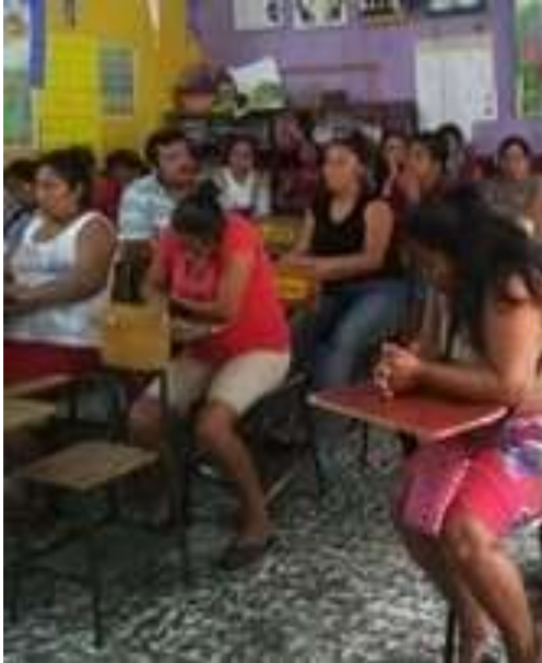
Fotografía 6: Reunión padres de familia

Se convocó a los padres y madres de familia a una reunión para informarles sobre la importancia de la fluidez verbal y comprensión lectora, promoviendo así el Proyecto de Mejoramiento Educativo.