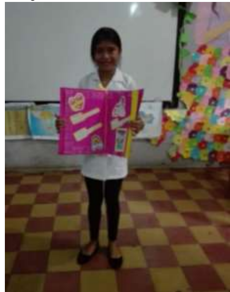
Fotografía 11: Creación de cuentos

Para esta actividad cada estudiante eligió dentro de varias imágenes presentadas un personaje y así crear un cuento propio. Se logró la participación de estudiantes que difícilmente participan e interactúan al desarrollar actividades en público, en donde fue satisfactorio ver el positivismo y creatividad al desenvolver y redactar historias.