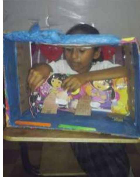
Fotografía 9: Elaboración de material

En estas actividades los estudiantes en compañía de la docente realizaron cada uno de los materiales a utilizarse en las diferentes actividades, en donde cada estudiante fue fabricando el Teatrino con las cajas de cartón reciclables de igual manera fabricaron títeres adecuándolos a las lecturas que presentaron, para realizar el mural de lectura se eligieron lecturas del diario, revistas, impresiones, entre otros. Con lo que respecta al troquelado a los estudiantes se les entregaron hojas de colores y solamente se les dio indicaciones de cómo