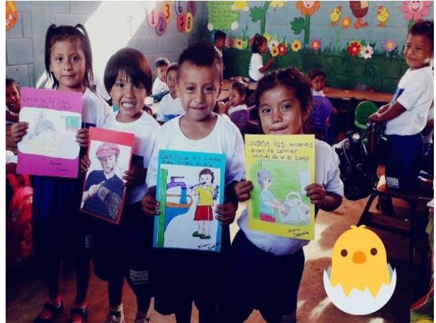
Fotografía No. 17. Exposición del tema: Hábitos de Higiene.

Los estudiantes exponen carteles sobre hábitos de higiene, con el apoyo de sus padres se han elaborado en casa utilizando cartulina, crayones y marcadores y el estudiante da una breve exposición sobre el hábito que le correspondió, esto ayudara a tener una mayor claridad los hábitos personales en cada estudiante.