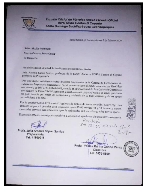
Fotografía No. 3: Solicitud de material didáctico a proveedores.

Ya que gracias al apoyo con sus donaciones de material didáctico y el alcalde en lo financiero se llevó a cabo la ejecución del Proyecto de Mejoramiento Educativo con los estudiantes de preparatoria.