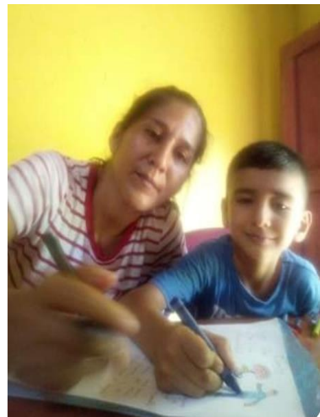
Fotografía No. 12. Apoyo en casa de parte de los padres de familia.

Con el involucramiento de padres de familia en el proyecto, se realizan cuentos con valores en casa en casa, inéditos o tradicionales, allí logramos una mejor relación de estudiantes con padres de familia, se logra más que se involucre en sus tareas y a la vez se logra el padre pueda enseñar valores jugando, creando, también a través de sus experiencias vividas en su niñez, su juventud, el padre pueda brindarle un poco más de tiempo a su hijo y así mejora la conducta del estudiante.