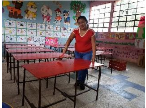
Fotografía No. 21. Pintado del mobiliario e identificación de los mismos.

Se logra la gestión para la pintura de las mesas ya que el ministerio de Educación brinda mobiliario en color madera y con el tiempo se penetra el sucio entonces se le da vida a las mesas con el propósito de que el estudiante se sienta en un ambiente agradable, con un color que le llame la atención así podrán colocar nombre al estudiante y donde es estudiante recalque el valor del respeto cada estudiante reconoce su lugar respetando la mesa con su respectivo nombre