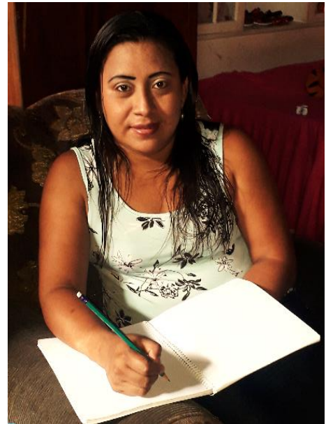
Fotografía No. 6. Realizando la respectiva planificación.

Como docente proyectista planteo un listado de actividades para la elaboración del proyecto de mejoramiento educativo donde se tuvo que hacer una selección para la ejecución utilizando las más importantes en el proyecto. Como todo proyecto tiene su costo se realizaron varias solicitudes a personas colaboradoras donde obtuvimos un 80% de aceptación en lo financiero, donde a través de un presupuesto nos podemos dar cuenta el costo económico del Proyecto de Mejoramiento Educativo para la buena formación de valores y hábitos de los estudiantes de preprimaria.