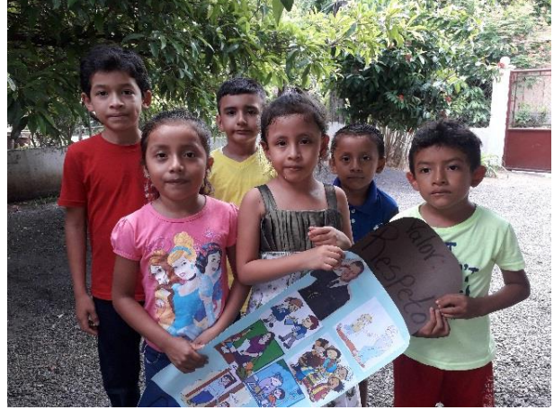
Fotografía No. 13. Cartel del valor el Respeto.

Los estudiantes trabajan en equipo, con observación de la maestra recortan y pegan imágenes de recortes sobre el valor del respeto donde el estudiante mientras trabaja aclara sus dudas a través de la observación de los recortes donde reconocen que deben de tener respeto por todas las personas sean mayores o menores que ellos, también existe el respeto por los animales y por la naturaleza debemos de amarla y cuidarla no ensuciándola.