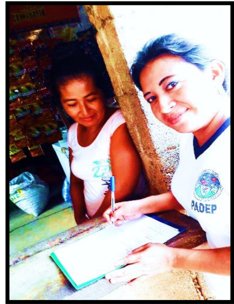
Fotografía No. 2. Entrevista a padres de familia.

Con el objetivo de contar con conocimientos previos acerca de la información que poseen los padres de familia, y como ellos los han transmitido a sus hijos.