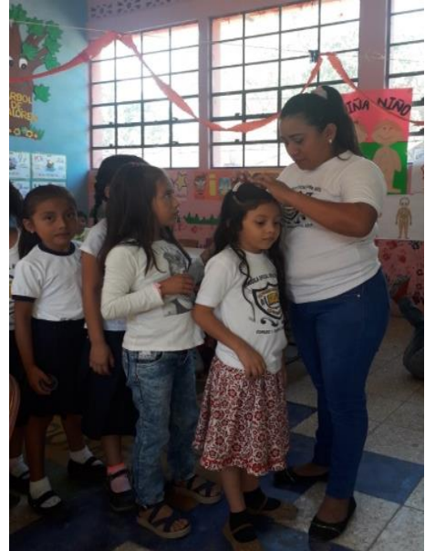
Fotografía No. 16. Limpieza de cabezas.

Así mismo se lleva un control de higiene dentro del salón de clases de preparatoria tomando en cuenta niños y niñas, como maestras debemos de tener el control en nuestros salones, la higiene es muy importante enseñarles a nuestros estudiantes que debemos de cortarnos las unas, lavarnos las manos con agua y jabón antes de comer y después de ir al baño, bañarnos todos los días, cepillarnos los dientes 3 veces al día, sacarnos los piojos, todo esto ayudara en su personalidad.