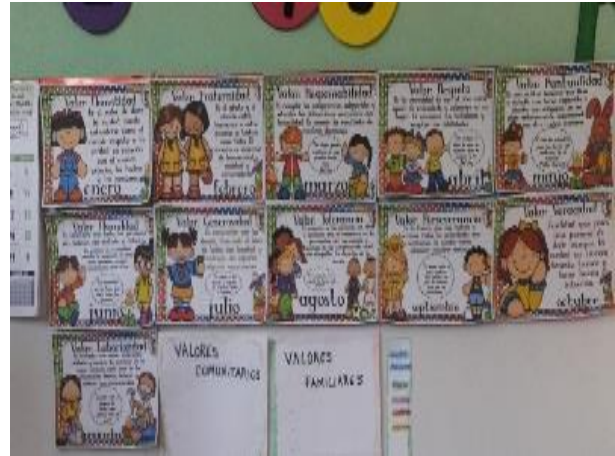
Fotografía No. 9. Cartel de los Valores impreso con su definición.

En el mes de enero se trabajó un cartel con el valor del mes Honestidad donde a través de recortes del periódico, revistas, Y del internet se realizó el cartel con la participación de estudiantes, luego se realizaron exposiciones del valor honestidad por estudiantes en todas las aulas de preprimaria, al retornar se forma ordenada hacia su salón de clases.