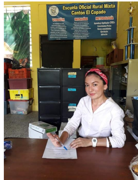
Fotografía No 1: Solicitud a la directora.

Por lo que se redacta una solicitud dirigida a la directora del establecimiento donde ella demuestra su apoyo con la estudiante en la realización de esta propuesta y experiencia con la que se pretende fortalecer el trabajo de las maestras del nivel preprimario y al estudiante en su conducta y sus buenos hábitos.