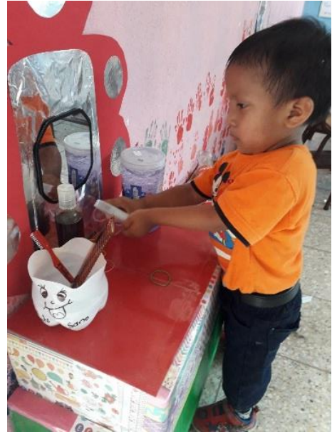
Fotografía No. 19. Rincón de Higiene.

En clase también cuenta con un rincón de higiene donde el estudiante juega de peinarse observándose a través de un pequeño espejo, también se limpia los zapatos con un pedazo de trapo viejo y húmedo, las niñas se hacen colitas y trenzas juegan de salón de belleza, pero recalcando que la higiene es para todos no importando su género.