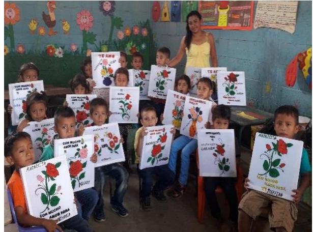
Fotografía No. 15. Manualidad del día de la madre.

Llega una fecha muy especial en el mes de mayo, donde la maestra y estudiantes se preparan con una manualidad en nuestra del amor que le tienen los niños a su mamá, los estudiantes muy contentos pintan con pincel y temperas el cuadro con y colocan el nombre de su madrecita de cada estudiante,