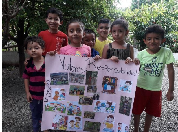
Fotografía No. 11. Cartel del Valor de la Responsabilidad.

Los estudiantes realizan un cartel sobre el valor de responsabilidad donde a través de recortes del periódico, revistas, imágenes son pegadas en una cartulina donde a través de recortes el niño comprende el valor de responsabilidad, donde por ser niño piense que no tenga responsabilidad y si las tiene, una de las responsabilidades del estudiante es realizar la tarea, ayudar en casa con el oficio si el niño es obediente y realiza tareas es porque está poniendo en práctica la responsabilidad.