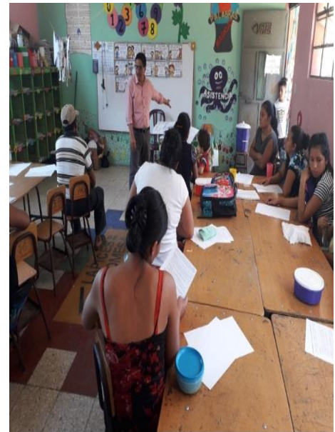
Fotografía No.5. Taller de los Valores a padres de familia.

Como docente proyectista realizo una invitación a nuestro Coordinador Técnico Administrativo para un taller sobre los tipos que valores que existen como valores institucionales, valores comunitarios, valores familiares y valores personales, las cuales se abordaron técnicas utilizando hojas de papel bond y crayones, donde los padres de familia realizan listados sobre los valores que practican en casa, el facilitador concientiza a los padres sobre la importancia de valores morales en su hijos en la primera etapa escolar.