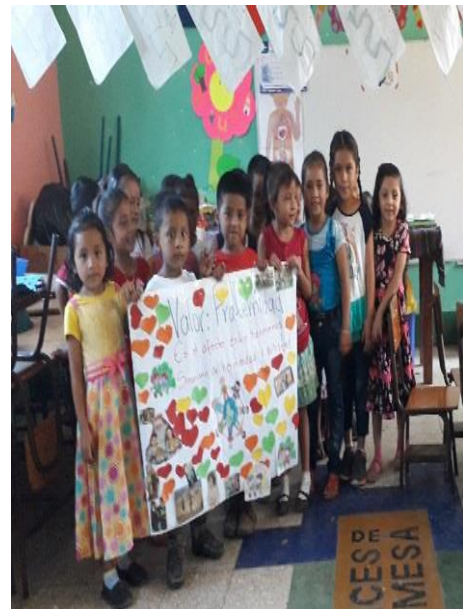
Fotografía No. 10 Cartel Valor de la Fraternidad.

En el mes de enero de trabajo el valor de la Fraternidad, un valor que nos llena de amor y paz dentro del salón de clases por lo mismo se recalca sin faltar un día durante todo el mes de febrero, mes del amor y la amistad donde los estudiantes conocemos más a fondo la palabra fraternidad que quiere decir amistad, compañerismo, cariño que debemos brindar a las personas que nos rodean así serán unos ciudadanos donde en todo momento tendrán las puertas abiertas.