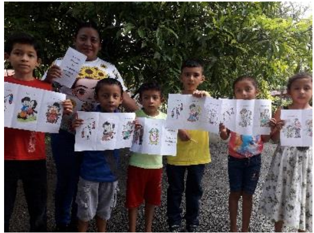
Fotografía No.14. Trifoliar de los Valores.

Para finalizar el tema de los valores se realiza un trifoliar de los practicados en el aula del mes de enero a mayo, el estudiante colorea el trifoliar con los colores adecuados, docentes de preprimaria, directora del establecimiento y padres de familia quedan muy contentos sobre las actividades realizadas durante los 5 meses quedando un 90% de éxito en la comunidad educativa.