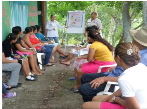
Fotografía No. 20. Charla con Padres de Familia sobre Hábitos de Higiene.

Los padres de familia también reciben charlas sobre la higiene personal de parte del centro de salud, por el bienestar de toda la comunidad en especial en los niños, los padres de familia deben de conocer los cuidados que debe tomar a la hora de preparar los alimentos, la higiene dentro y fuera de la casa, una enfermera da a conocer las consecuencias que hay cuando tienen cuidado de ellos.