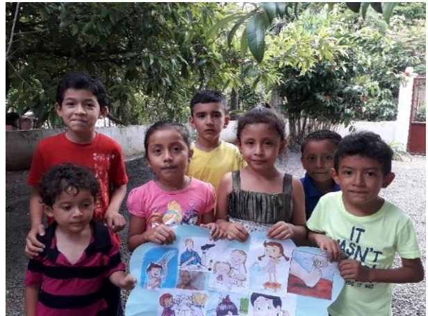
Fotografía No. 18. Collage sobre la higiene personal.

Los estudiantes elaboran un collage sobre la higiene personal que debe tener cada persona desde pequeño, para tener una mejor vida saludable, los estudiantes de preparatoria realizan este collage para darle un mejor ambiente al salón de clases un cartel realizado por ellos donde le han puesto mucha dedicación y cariño.