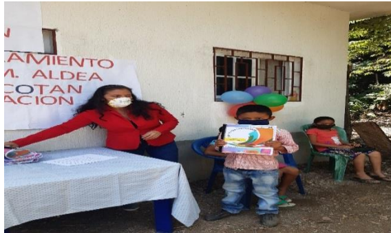
Fotografía 17 Cierre del Proyecto Entrega de diploma a cada uno de los niños que culminaron las actividades descritas en la cartilla.

El cierre de la actividad se llevará a cabo con la presentación de la mini clase modelo, en la cual se establecerá una serie de actividades referentes al tema de la Cartilla de sexualidad. Y de igual forma la entrega de la cartilla a alumnos y docentes del establecimiento.