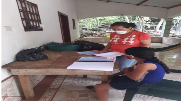
Fotografía 9 Implementación Implementación de Cartilla de Educación Sexual.

Es una de las fases donde se plasma cada una de las actividades dentro del cronograma, con fechas estipuladas, para poder emprender la implementación del proyecto de mejoramiento educativo, en esta oportunidad