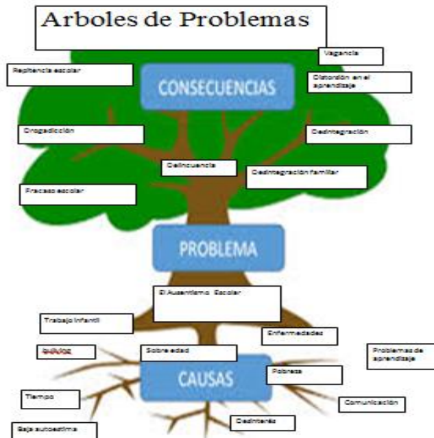
Fotografía 1 Árbol de problemas

A la corta edad de los estudiantes de tercer grado primaria, es preocupante que desconozcan sobre los temas de sexualidad, también dentro del árbol se pueden observar las causas que hacen de este tema un tema tabú, la cultura, las costumbres el tipo de religión que procesas y los efectos son estudiantes tímidos con respecto a entablar un diálogo sobre el tema de sexualidad.