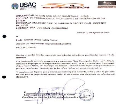
Fotografía 8 Autorización Carta de autorización del director.