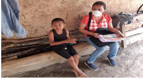
Fotografía 15 Evaluación Visita para evaluar la implementación de la Cartilla.

Se realizó a través, de una lista de cotejo sobre la comprensión lectora de los niños de tercer grado y también la presentación de la cartilla leída.