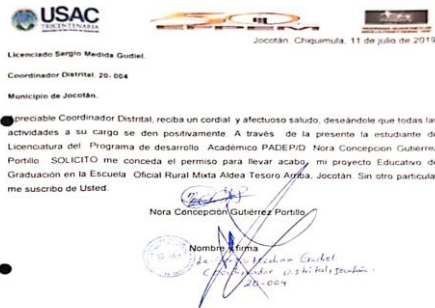
Fotografía 7 Solicitud Carta de solicitud.

Diseño y entrega, de las notas de autorización como la nota de respuesta enviada para el supervisor educativo.