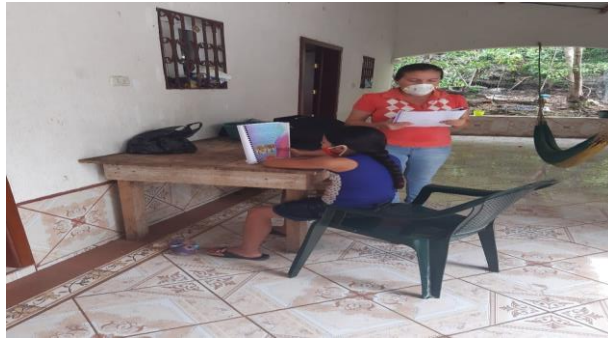
Fotografía 13 Monitoreo Visita domiciliar para Monitorear el avance.

Esta fase también se elaboró de una forma distinta, es aquí donde la docente, entrego las instrucciones a los estudiantes, y se percató que realizara las diferentes lecturas de la cartilla y su comprensión.