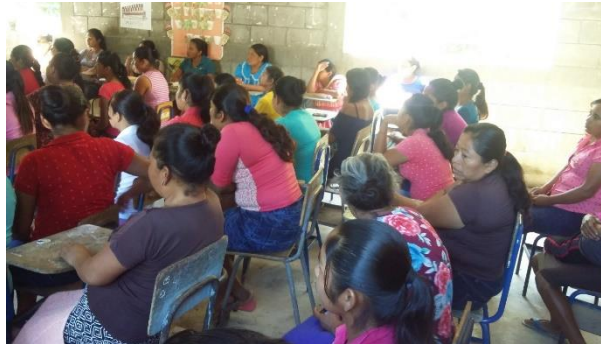
Fotografía 10 Socialización Reunión con padres de familia para Socialización de cartilla.