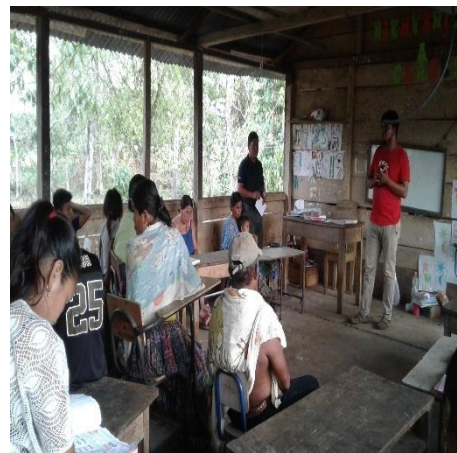
Foto No. 2 Capacitación a padres de familia y docentes

En esta fase se fortaleció la comunicación verbal con los miembros del COCODES, docentes, padres de familia. Se planificó el apoyo para el acompañamiento de las charlas sobre estrategias educativas para disminuir el fracaso escolar a instituciones que manejen el tema como la Coordinación Educativa y el sistema nacional de acompañamiento escolar (SINAE).