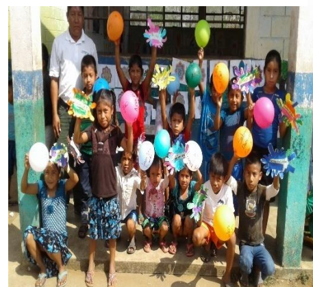
Foto No. 3 Exposición de pintura con estudiantes.

Durante esta fase se implementaron estrategias para disminuir el bajo rendimiento académico de los estudiantes, a través de reuniones con padres de familia para socializar la importancia de realizar actividades educativas para disminuir el fracaso escolar, los padres de familia y docentes apoyaron las actividades educativas que se aplicaron en beneficio de la población estudiantil. Se organizaron los espacios para luego llevar a cabo las charlas en horarios y días según cronograma de la planificación.