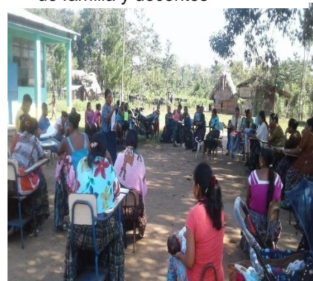
Foto No. 1 Reunión con padres de familia y docentes

proyecto, además me motivó a seguir adelante en mi carrera profesional. Se realizó la socialización del proyecto de Mejoramiento Educativo, con padres de familia, docentes, estudiantes, miembros del COCODES, docentes, los resultados obtenidos fueron satisfactorios ya que los padres de familia quedaron de acuerdo en la ejecución del Proyecto.