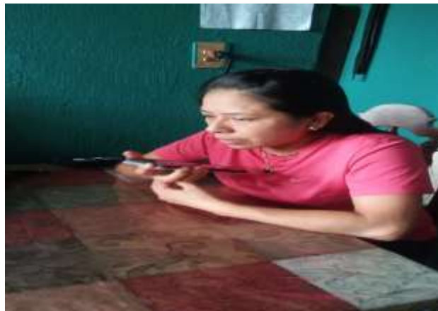
(Mayo 2020)