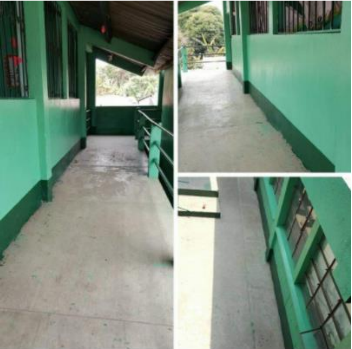
Ilustración 30 Finalización del proyecto de mantenimiento de pintura de la escuela. Fecha: octubre 2020.