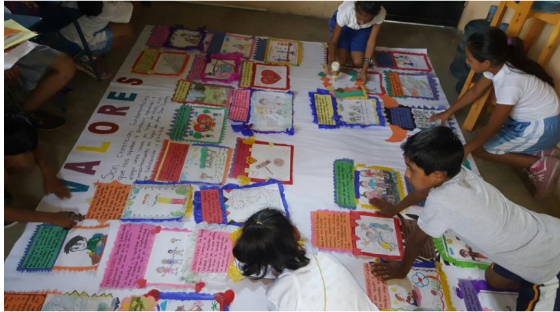
Ilustración 17 Elaboración del periódico mural en equipo de trabajo. Fecha: octubre 2020.