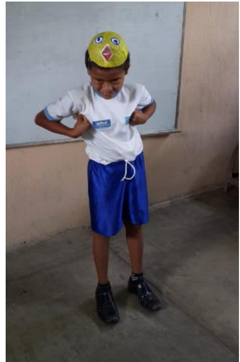
Ilustración 24 Creación de gorros y coronitas con material reciclado. Fuente España, T. Fecha: octubre 2020.