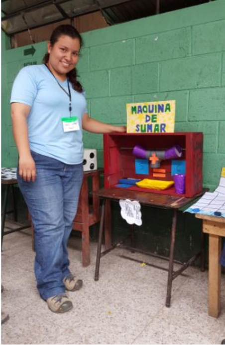
Ilustración 20 Elaboración de la máquina sumadora con material reciclado para el aprendizaje de los estudiantes. Fecha: octubre 2020.