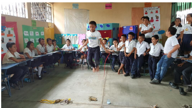
Ilustración 14 Reconocimiento de rincones de aprendizaje por área, estudiantes realizan las actividades de Contemos Juntos y el área de matemáticas: Saltos de cuerda, trompo, canicas, yacks, basándose en las operaciones básicas, según lo que les indique cada una de las estaciones. Fuente España, T. Fecha: octubre 2020.