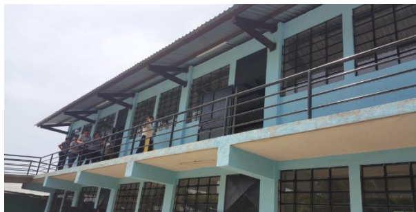
Ilustración 4 Fotografía de escuela. Fecha: octubre 2020

La Escuela Oficial Rural Mixta Aldea Día de Reyes, está construida de bock, cemento, metal y vidrio, está formada por 2 módulos, el primer módulo tiene segundo nivel, con una rampa para los niños con Necesidades Educativas Especiales; el segundo módulo está en etapa de construcción. La escuela