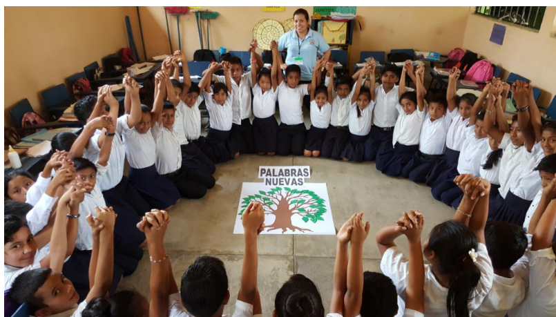
Ilustración 10 Docente orienta a los estudiantes para la realización de la actividad de palabras nuevas. Fuente España, T. Fecha: octubre 2020.