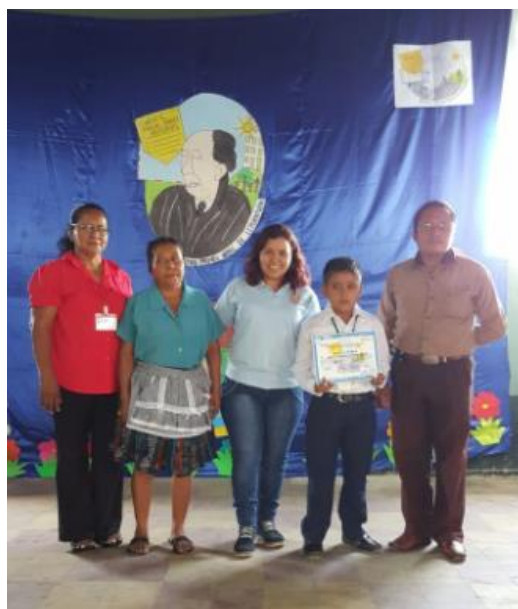
Ilustración 28 Apoyo de docente y madre de familia en el concurso de lectura. Fuente España, T. Fecha: octubre 2020.