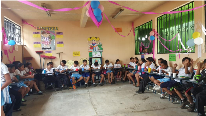
Ilustración 16 Ubicación de escritorios en forma de U. Fecha: octubre 2020.