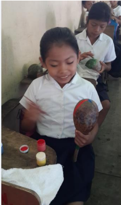
Ilustración 23 Creación de chinchines con material reciclado. Fecha: octubre 2020.