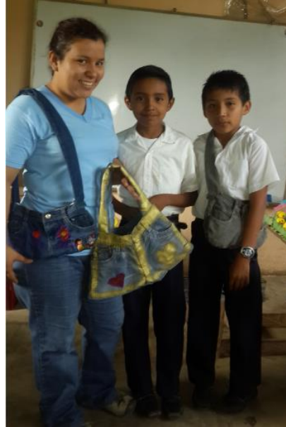
Ilustración 7 Finalización de bolsas con material reciclado. Fuente España, T. Fecha: octubre 2020.