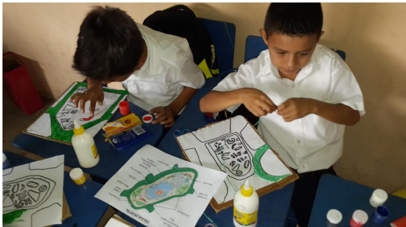
Ilustración 12 Elaboración de las células utilizando la técnica de entorchado, plastilina y témperas. Fecha: octubre 2020.