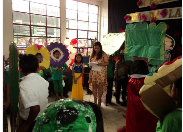
Ilustración 19 Presentación de cuentos, utilizando material reciclado. Fuente España, T. Fecha: octubre 2020.