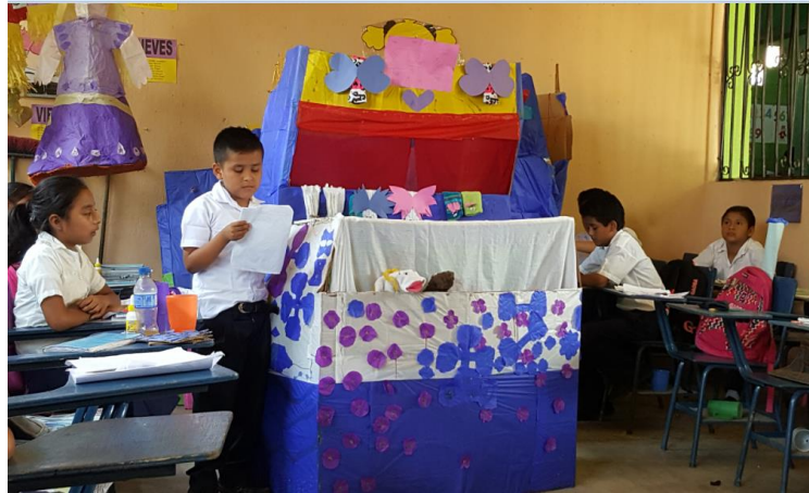
Ilustración 22 Elaboración de teatrines con material reciclado. Fuente España, T. Fecha: octubre 2020.