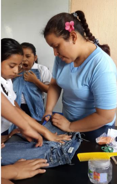
Ilustración 6 Docente brinda apoyo a los estudiantes al elaborar las actividades.