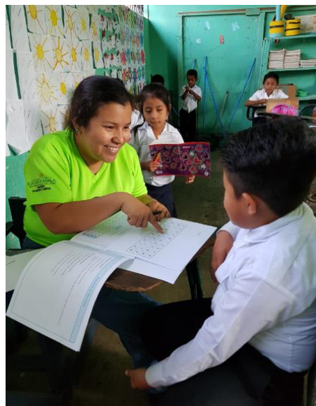
Ilustración 3 Fotografía de Aspecto Pedagógico. Fecha: octubre 2020

También se cuenta con diferentes técnicas como: tendedores, carteles, rincones de aprendizaje, de limpieza, de valores, de normas de convivencia, Diferentes Organizadores Gráficos; cada estudiante realiza su portafolio en donde guardan las actividades realizadas, adentro del aula se cuenta con materiales de apoyo para el aprendizaje de los estudiantes como: libros de lectura de la Biblioteca Escolar, libros de texto de matemática, Comunicación y Lenguaje, Ciencias