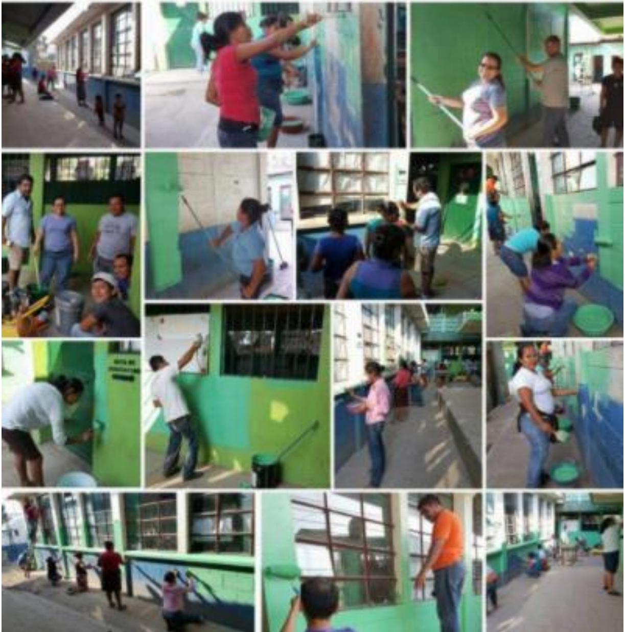
Ilustración 29 Apoyo de docente, directora y padres de familia para la ejecución del proyecto de mantenimiento de la escuela. Fecha: octubre 2020.