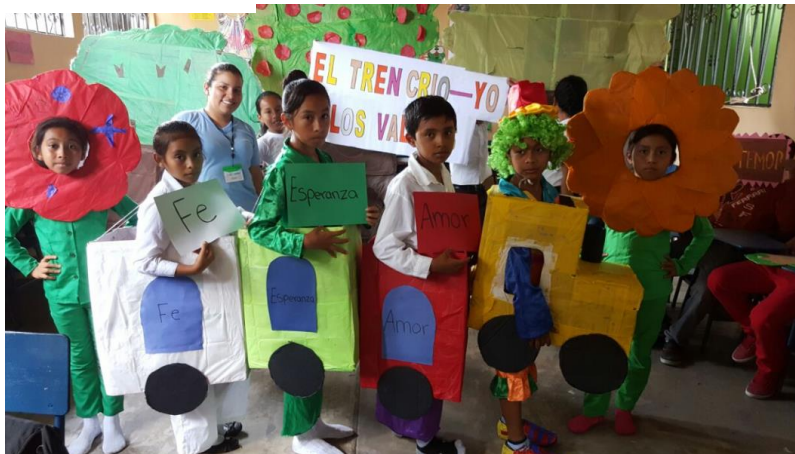
Ilustración 8 Presentación de la actividad "El Tren Crio-Yo. Los Valores". Fuente España, T. Fecha: octubre 2020.