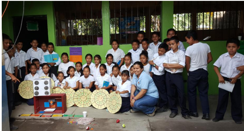
Ilustración 11 Docente y estudiantes presentan el rincón de aprendizaje del área de matemáticas. Fecha: octubre 2020.