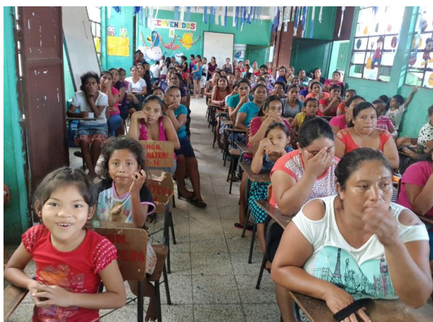
Ilustración 27 Asistencia de madres y padres de familia en las reuniones. Fecha: octubre 2020.