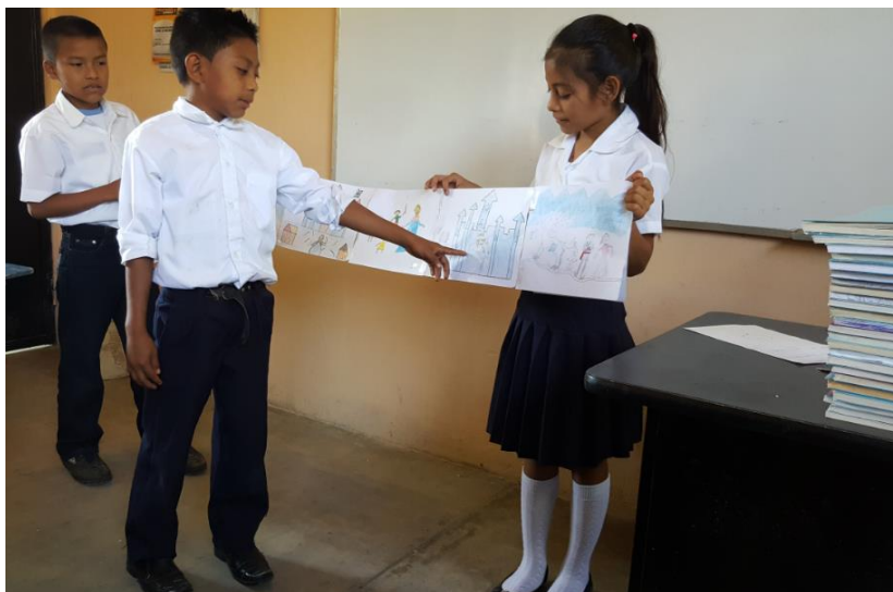
Ilustración 13 Creación de un libro de secuencias con la técnica de Frizo o acordeón. Fecha: octubre 2020.