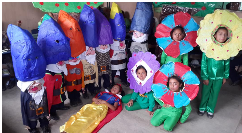
Ilustración 21 Utilización de elementos para la dramatización con material reciclado. Fuente España, T. Fecha: octubre 2020.