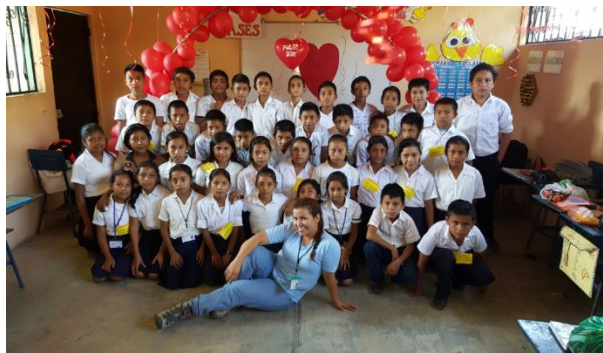
Ilustración 2 Fotografía de aula. Fecha: octubre 2020

con energía eléctrica. El aula mide 8 metros y 9 metros de largo, en la parte de afuera tiene un pasillo de 19 metros de largo por 3 de ancho.