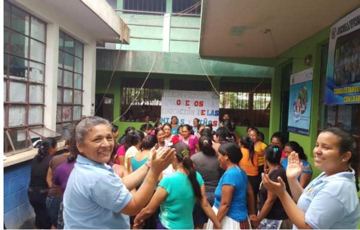
Ilustración 25 Participación de madres y padres de familia en la dinámica que se realiza en las reuniones de la escuela. Fecha: octubre 2020.