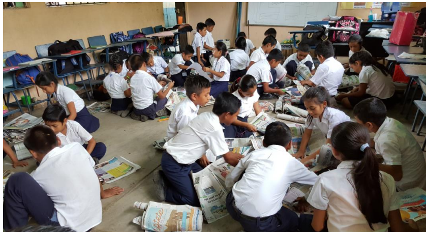
Ilustración 18 Utilización del espacio del aula para trabajar en equipos. Fuente España, T. Fecha: octubre 2020.