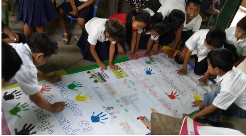
Ilustración 15 Elaboración de carteles en equipos de trabajo. Fuente España, T. Fecha: octubre 2020.