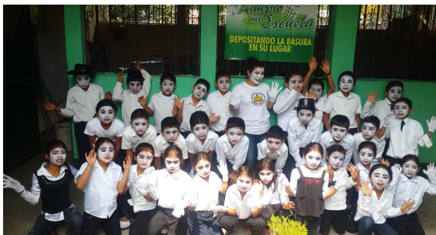
Ilustración 9 Docente y estudiantes realizan la presentación de mimos. Fecha: octubre 2020.