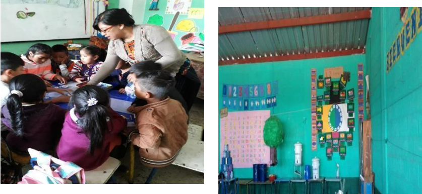
Ilustración 3. Fase de monitoreo.