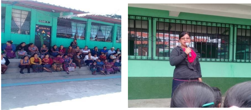
Ilustración 2. Realización de talleres en padres de familia.