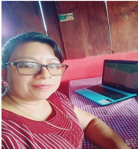
Ilustración 1. Fase de inicio del PME.