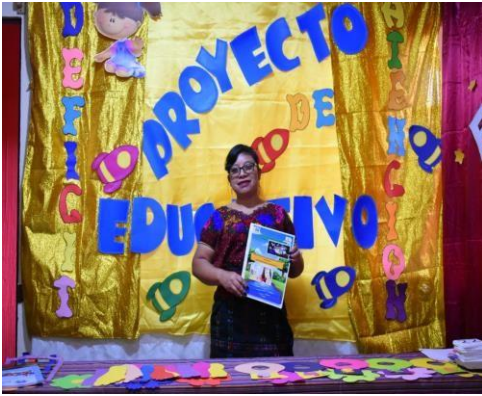
Ilustración 4. Entrega de revista pedagógica