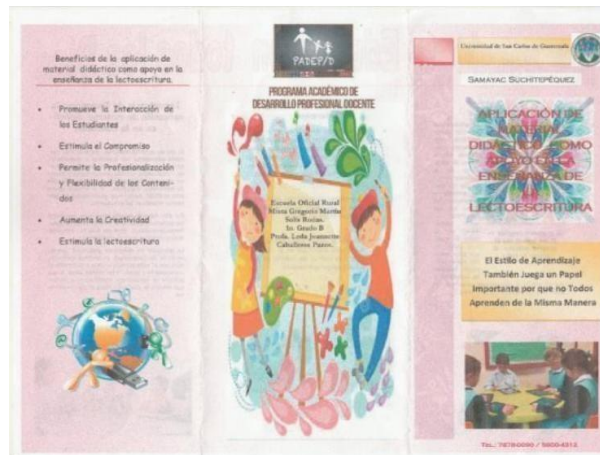
Ilustración 6 TRIFOLIAR

Se aprovechó la entrega de alimentos para informar a padres de familia sobre la culminación del proyecto.