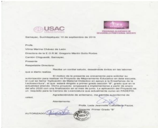
Ilustración 2 CARTA DE AUTORIDADES