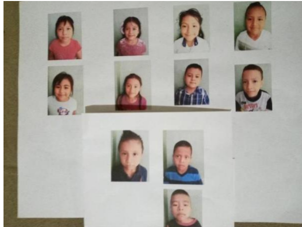
Ilustración 11 ALUMNOS PRIMER GRADO "B"