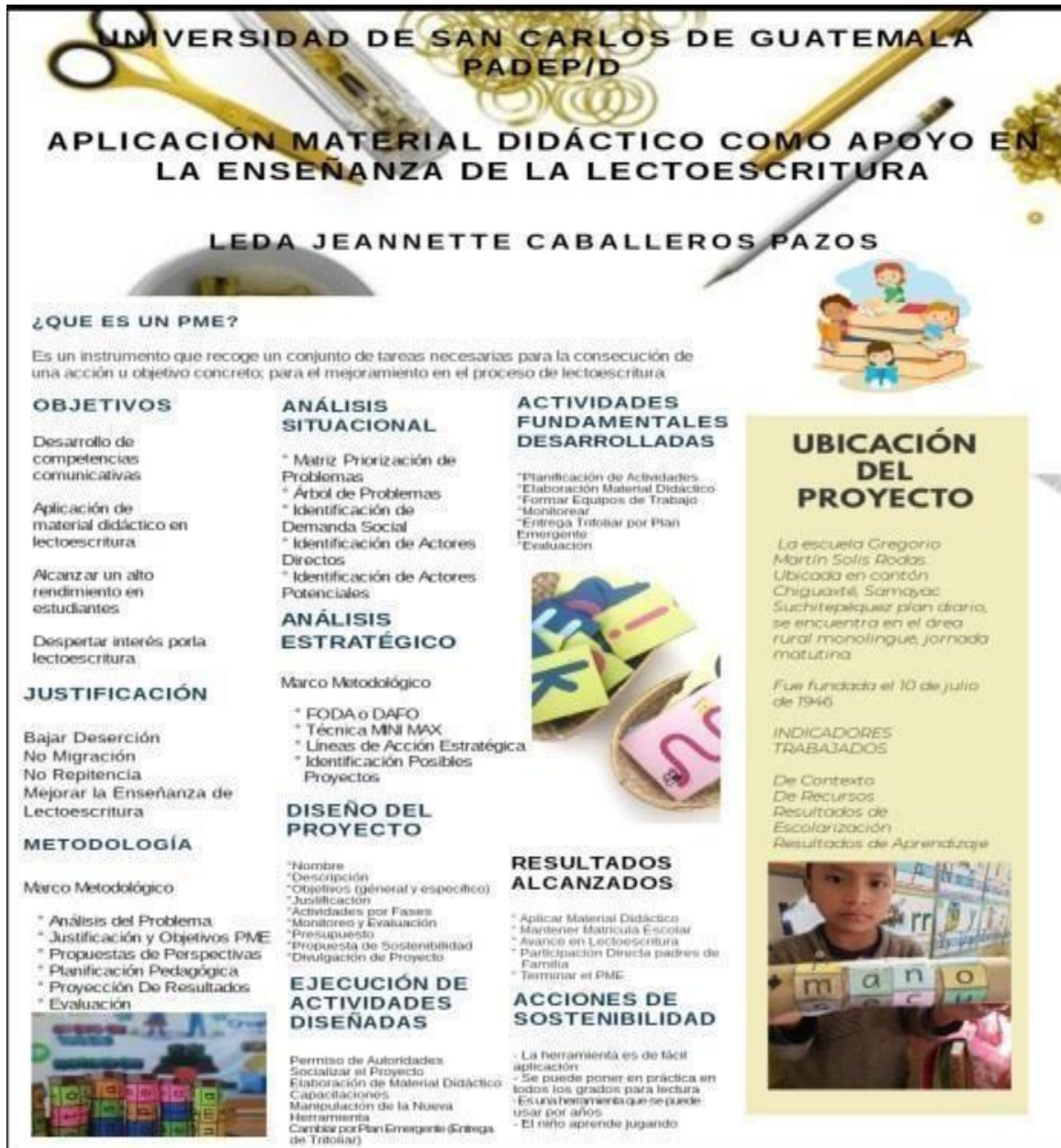
Ilustración 12 POSTER ACADÉMICO