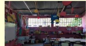
Presentación del aula decorada