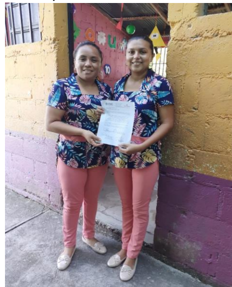
Fotografía No. 2 Entrega de permiso a la directora

Para presentarles el Proyecto de Mejoramiento Educativo, el cual se detalló por fases que lo conforman y cada una de las actividades que integran cada una de las fases y el plan de trabajo.