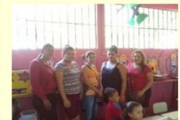
Participación de los padres de familia