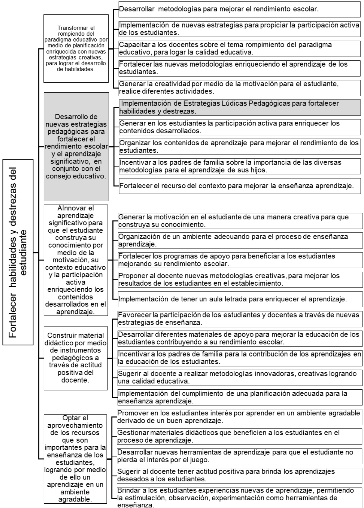
Tabla No. 5 Mapa de soluciones