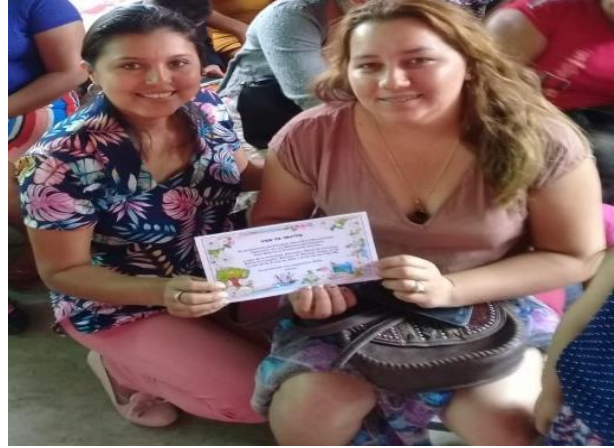
Fotografía No. 4 Entrega de invitación a padres de familia

En esta actividad se realizó la entrega de las invitaciones elaboradas para cada uno de los padres de familia, con motivo de convocar a una reunión, dando a conocer el tema importante implementación de estrategias lúdicas pedagógicas para fortalecer habilidades y destrezas, de los estudiantes para mejorar el rendimiento escolar.