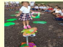
Estudiante desarrollando habilidades y destrezas