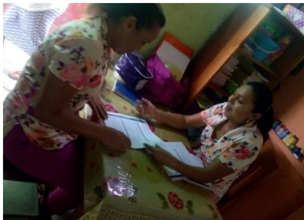
Fotografía No. 18 Monitoreo del proyecto

Se desarrolló el monitoreo de cada una de las actividades para lograr ver los objetivos propuestos si se cumplieron a cabalidad con la colaboración de la directora del centro educativo como también de la docente, a implementar estrategias lúdicas pedagógicas para fortalecer habilidades y destrezas, en la etapa de cinco años, de la Escuela Oficial de Párvulos, Barrió El Campito, Jornada Matutina, del Municipio Melchor de Mencos, Petén.