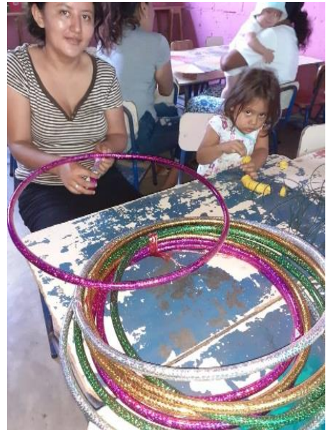
Fotografía No. 7 Participación de padres de familia

Para mejorar el rendimiento en los estudiantes se quiere que los padres de familia y docente estén comprometidos con la educación de sus hijos, es de vital importancia en cuanto al proceso formativo de los niños, entre ellos se debe establecer un clima cordial de confianza, así como una comprensión mutua, a través del diálogo, la cual obtendrán a medida que trabajen de forma conjunta.