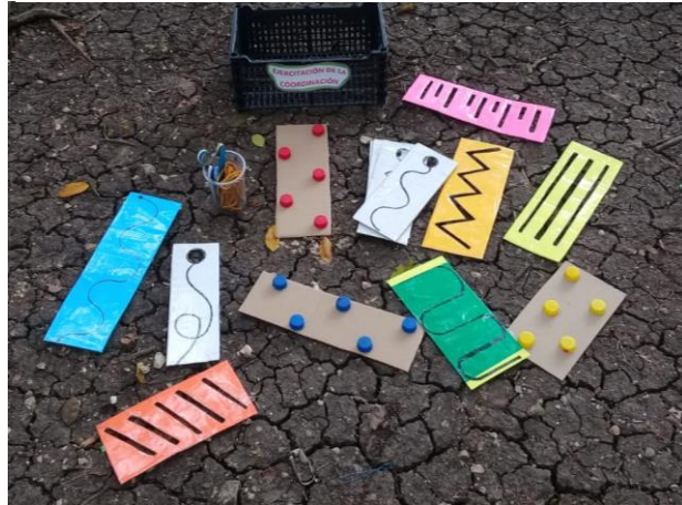
Fotografía No. 6 Diseño y elaboración de materiales

Se realizaron materiales facilitando lograr estrategias pedagógicas creativas rompiendo un paradigma educativo, cuyo pilar fundamental es la calidad de la educación como factor importante del desarrollo generando igualdad en todo sentido. El uso de los diferentes procesos de aprendizaje como practicas del