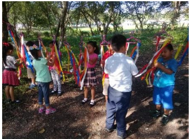
Fotografía No. 11 Estudiantes coordinando movimientos específicos

En esta actividad se desarrollaron juegos participativos donde los estudiantes se motivaron, de una forma divertida pero a la vez aprenden contenidos que se llevan a la práctica de una forma diferente porque el niño interactúa con los recursos beneficiándose de los aprendizajes, que serán de utilidad para su desarrollo.