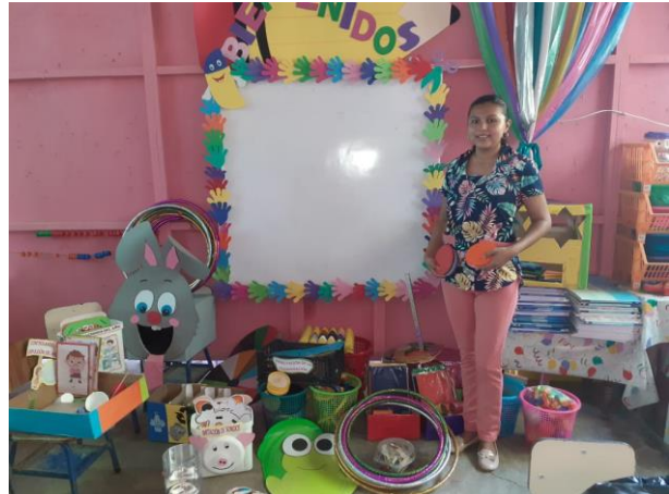
Fotografía No. 9 Exhibición de materiales

Los recursos didácticos que facilitan tener estrategias pedagógicas, a partir de hacer materiales que constituyen un apoyo valioso en el desarrollo de las actividades de aprendizaje, sus características varían de acuerdo a sus utilidades y sirven como: un medio para motivar, desarrollar, reforzar y consolidar aprendizajes, la implementación de materiales del contexto como medio para presentar los resultados de actividades, logrando el proceso de observación estrategias, análisis, formulación de conceptos y concretar experiencias de comunicación.