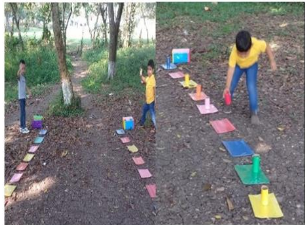
Fotografía No. 10 Juego aprendiendo a identificar colores

Se realizaron actividades con el fin de que el proyecto pedagógico promueva el desarrollo integral del niño en edad preescolar a través de la práctica de los juegos lúdicos y su adaptación como herramienta de enseñanza en espacios de aprendizajes del aula o en el contexto escolar, la lúdica es la clave fundamental en la infancia, facilitando que el estudiante aprenda de manera placentera a desenvolverse en el entorno, internalice normas y costumbres de la sociedad a la que pertenece, para que de esta forma inicie su proceso de socialización e interacción con el medio.