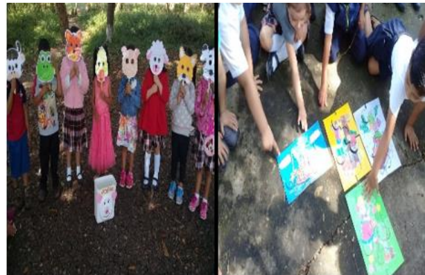
Fotografía No.16 Niños participando en actividades de enseñanza

El niño tiene derecho al juego, al descanso, a la diversión y a dedicarse a las actividades que más le gusten se definen el juego, como el primer instrumento que posee la niñez para aprender y para conocerse, el desarrollo de una actividad ayuda a saber cómo se desempeña él ante nuevas acciones, la manera cómo se comporta, la forma de ser y la manera de que interactúan con las demás personas.