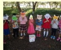
Estudiantes participando en las actividades de enseñanza aprendizaje