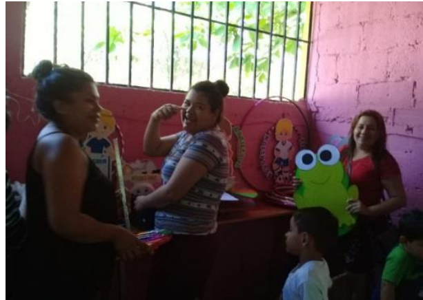
Fotografía No. 15 Participación de madres de familia

Contar con el apoyo de los padres de familia, que también ayudaron a que los recursos fueran enriquecidos es muy satisfactorio ver el cambio que se puede hacer en la educación, enriqueciendo la dotación de recursos y materiales pedagógicos con elementos que favorezcan la integración, en esta actividad se pudo ver la cooperación entre cada uno de los padres clasificando los materiales para colocarlos en un espacio determinado, en el cual a los niños se les facilite los recursos, estando al pendiente de cada detalle.