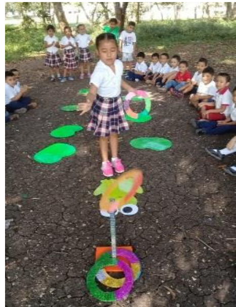
Fotografía No.17 Actividad de movimientos corporales

Se desarrolló juegos con los estudiantes de la etapa de cinco años en los cuales el juego es parte fundamental en la niñez, con el fin primordial de trabajar y aprender por medio de él estando relacionados al mismo tiempo no se puede separar una cosa de otra, en el momento que juega, el estudiante puede desarrollar la imaginación, la capacidad creativa, el juego constituye el núcleo esencial del progreso, sin experimentación, y manipulación, sin la intervención de estrategias de acción, el estudiante no conquistaría nuevos espacios, no descubriría ni recorrería nuevos caminos.