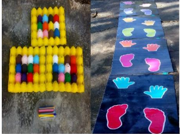
Fotografía No. 12 Juegos de aprendizaje

La implementación de los rincones de aprendizaje son espacios que beneficiaran a mejorar el rendimiento escolar, organizándolos para que los niños desarrollen habilidades, destrezas al construir conocimientos a partir del juego y la interacción libre, los rincones de aprendizaje ofrecen a los estudiantes la posibilidad de practicar juegos, actividades variadas, dentro de un ambiente rico en alternativas de acción individual y colectiva.