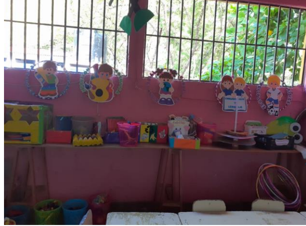
Fotografía No.13 Presentación de los rincones de aprendizaje

Por medio de la presentación de los rincones de aprendizaje se logra que los niños obtengan experiencias que estimulen las diferentes áreas de desarrollo, comunicación y lenguaje, destrezas de aprendizaje, educación física, expresión artística, conociendo el mundo social y natural, convirtiendo una actividad de aprendizaje o de trabajo en juego, diversión y descubrimiento.