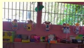
Presentación de los rincones de aprendizaje