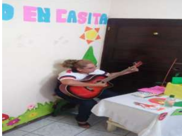
Ilustración 7 Canción sobre medidas de higiene en tiempos del COVID -19

Actividad emergente: Consistió en la interpretación de una canción de Pin Pon modificada para fomentar el lavado de manos por la pandemia del COVID -19. Además, un juego que fomentó el aprendizaje de las figuras geométricas. Estas actividades se desarrollaron a través de un video que fue transmitido por medio de las redes sociales.