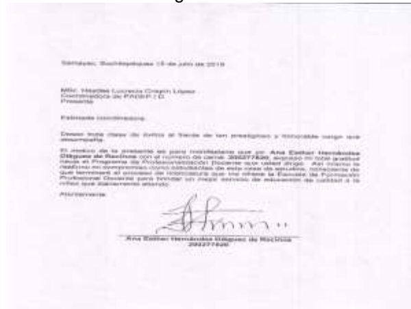
Ilustración 2 Carta dirigida a coordinadora PADEP / D