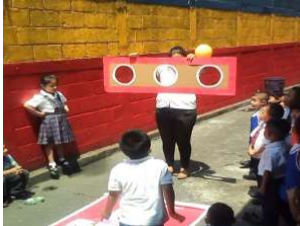
Ilustración 5 Actividad sobre motricidad gruesa

decisión de lanzar una pelota para que pasara sobre un agujero que se encontraba a cierta distancia. Por lo que se estimuló además de su motricidad gruesa, su pensamiento lógico.