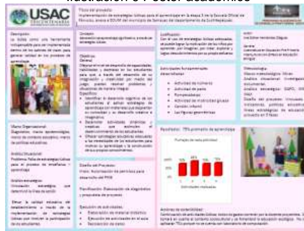
Ilustración 9 Poster académico

Además, se contó con el apoyo de un póster académico que cuenta con la información más relevante del PME