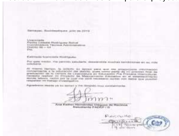
Ilustración 1 Autorización de CTA para el proyecto