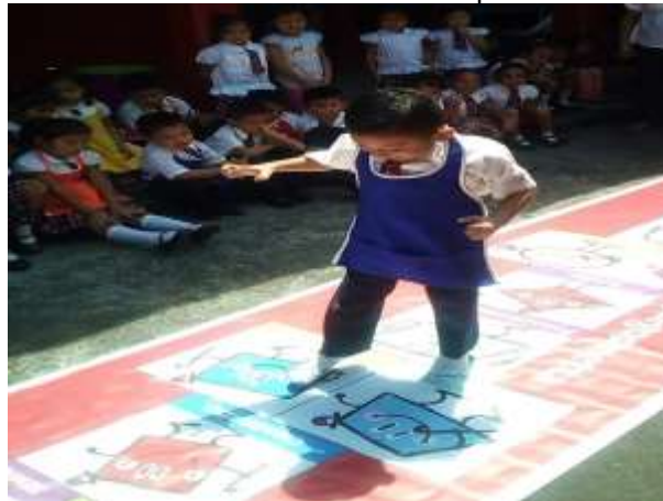
Ilustración 4 Actividad de patio

Actividad de patio: A través de una manta con figuras, los niños debían moverse dentro de ella, colocando sus pies sobre cada espacio que se le indicaba y debía tener el control de su equilibrio, su espacio y sus movimientos. Hubo un aprendizaje bastante interesante en esta actividad, pues todos participaron y se desarrollaron en su participación de acuerdo a sus alcances y a su aprendizaje significativo.