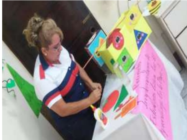
Ilustración 8 Enseñanza sobre las figuras geométricas