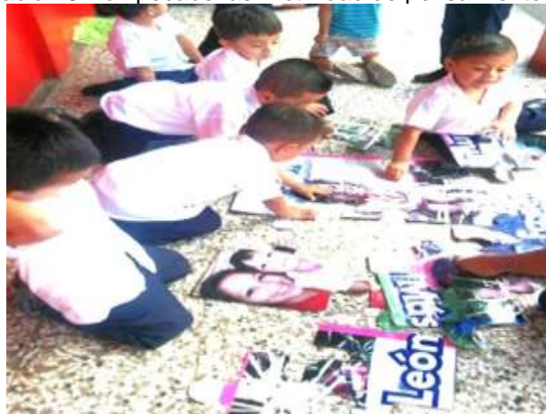
Ilustración 6 Rompecabezas. Actividad de pensamiento lógico

Actividad de rompecabezas gigantes: El grado completo participó en esta actividad, en donde se contó con piezas gigantes de rompecabezas y se motivó a cada estudiante a que colocara una pieza en el espacio que consideraba adecuado para hacer coincidir las todas. Se mostraron aspectos positivos de trabajo en equipo, colaboración, cooperación, tolerancia y respeto, además que todos jugaban y se divertían hasta que se logró tener todas las piezas armadas.