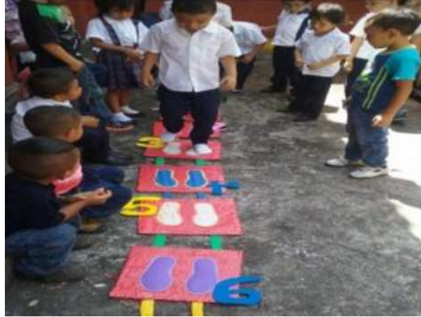
Ilustración 3 Actividad de conteo de números