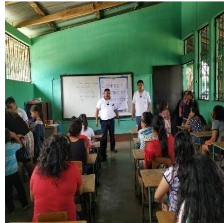
Foto 2 Presentación del PME a Padres de Familia

En la fase de planificación del Proyecto de Mejoramiento Educativo, se organizaron las estrategias pedagógicas que se aplicaron con los estudiantes, docentes y padres de familia.