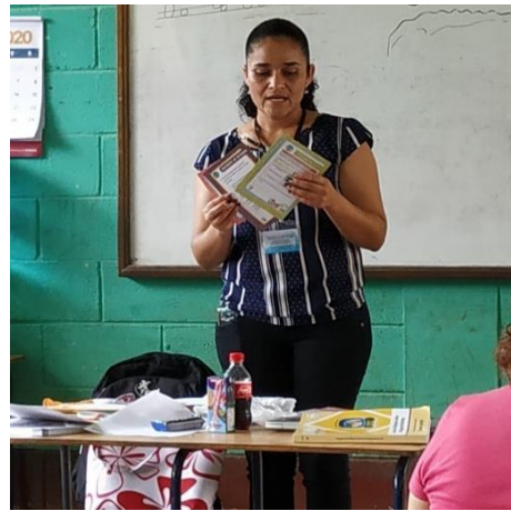
Foto 4 Asesora Pedagógica del SINAIE.

En el proceso de ejecución del Proyecto de Mejoramiento Educativo, se desarrollaron un sesenta por ciento de fases programadas en el Plan de Actividades y el Cronograma de actividades por la suspensión de clases a nivel nacional a causa de la pandemia COVID-19. Las actividades restantes se llevaron a cabo con un plan emergente, para fortalecer las estrategias pedagógicas y cumplir con los objetivos del PME.