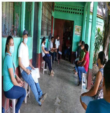
Foto 6 Presentando Informe Final del PME a Compañeros Docentes