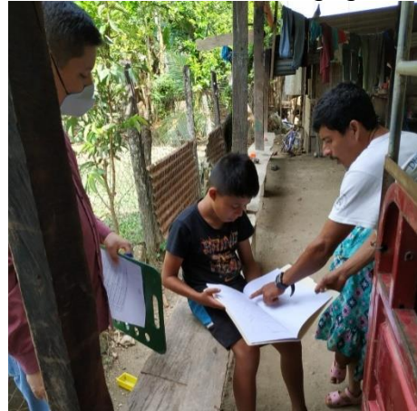
Foto 5 Visitas Domiciliares Para Reforzar Contenidos Pedagógicos.

Algunas actividades fueron modificadas por el confinamiento obligatorio que se está viviendo. Las actividades descritas en hojas de papel bond, mensajes de texto, audios o visitas domiciliarias fueron las estrategias de monitoreo constante.