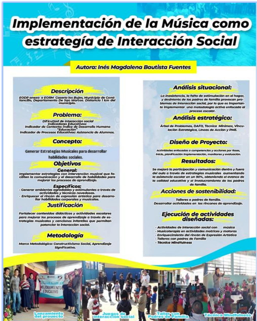
Figura 38. Poster Académico: Implementación de la Música como Estrategia de Interacción Social

Como parte del compromiso ante la universidad y comunidad educativa se dará a conocer a la directora del establecimiento, personal docente y niños del nivel primario y preprimario un Poster Académico del proyecto ejecutado incluyendo información relevante que estará visible en la dirección del establecimiento para fines informativos, evidenciar logros obtenidos y colaborar en la promoción del nivel preprimario.