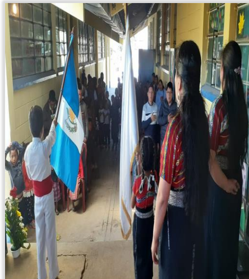
Figura 15. Acto Protocolario en Lanzamiento

El lanzamiento del proyecto se realizó con el fin de involucrar a todo el establecimiento empezando por los niños quienes colaboraron en el acto protocolario vistiendo el traje típico que representa al municipio de Comitancillo. Esta actividad se explicó la metodología y objetivos a trabajar en el PME, los beneficios a obtener con los niños y la incidencia sobre la problemática encontrada en los indicadores educativos observados en el nivel preprimario específicamente con los niños de párvulos,