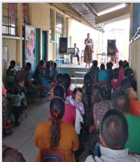
Figura 12. Participación de la directora del establecimiento en taller programado