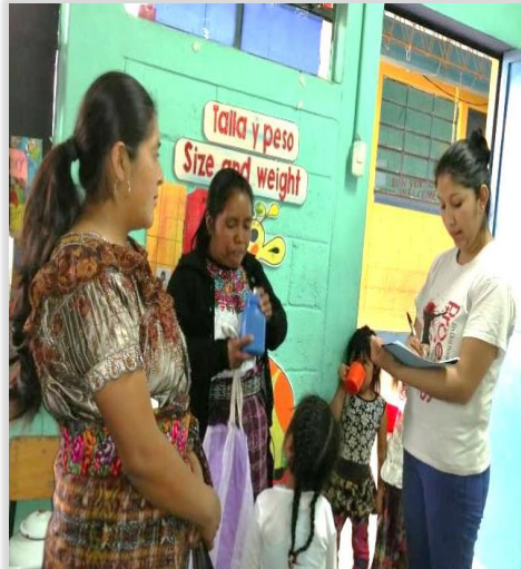
Figura 19. Llenado de Datos de Observación con padres de familia.

En esta fase de ejecución se Implementaron actividades de interacción social con música específicamente en el periodo de adaptación en donde se organizaron actividades interactivas por día durante el periodo de adaptación y socialización en el ámbito escolar. Como primera instancia se convocó a los padres de familia para dar a conocer informaciones sobre la metodología a trabajar, datos de observación y comunicación por grupos.