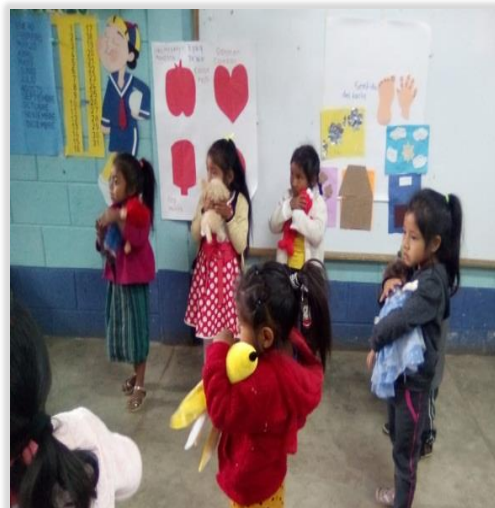
Figura 22. Utilización de musicoterapia, relajación con peluches.

También se implementaron actividades de Relajamiento con la Técnica y música Mindfulness y musicoterapia con materiales disponibles del entorno o didácticos utilizados según la actividad.