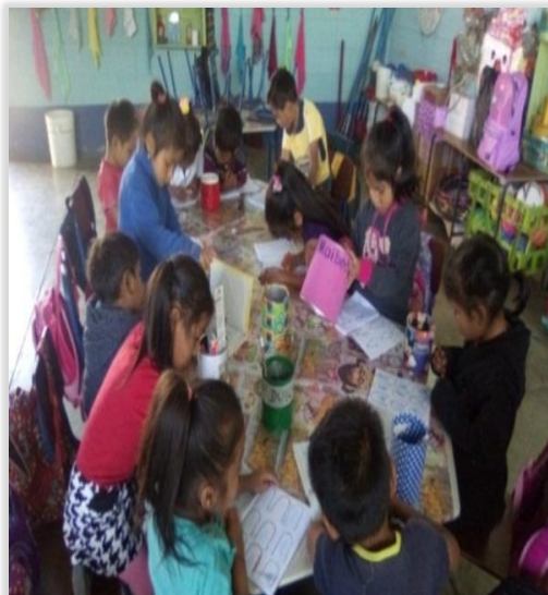
Figura 24. Ejercicios grafo motrices

Esta es una descripción general de lo que se trabajó en el establecimiento, las actividades están especificadas por semana y día en el plan de adaptación incluyendo los links de juegos y canciones utilizadas, las cuales están adjuntas en el anexo.