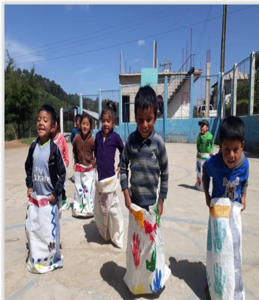
Figura 32. Niños compitiendo en circuitos con costales decorados por ellos mismos.