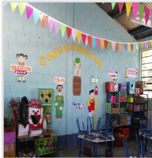
Figura 34. Enriquecimiento de materiales didácticos y rincones de aprendizaje.

a los padres por medio de reuniones, talleres e informes sobre el avance y necesidades de los estudiantes.