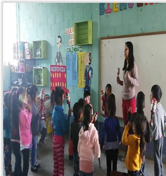
Figura 28. Niños cantando utilizando chinchines e instrumentos musicales del rincón. Fuente: Elaboración propia