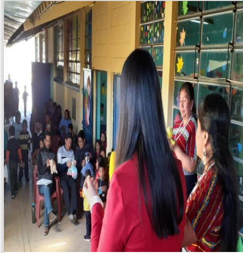
Figura 17. Demostración de Técnica y Música Mindfulness con la comunidad educativa.

Se dio a conocer la presentación y exposición de técnicas y estrategias a trabajar a través de actividades de interacción social utilizando la música con las autoridades educativas y comunitarias, para demostrar parte de las rutinas que se estaban realizando con los niños utilizando materiales acordes a cada actividad.