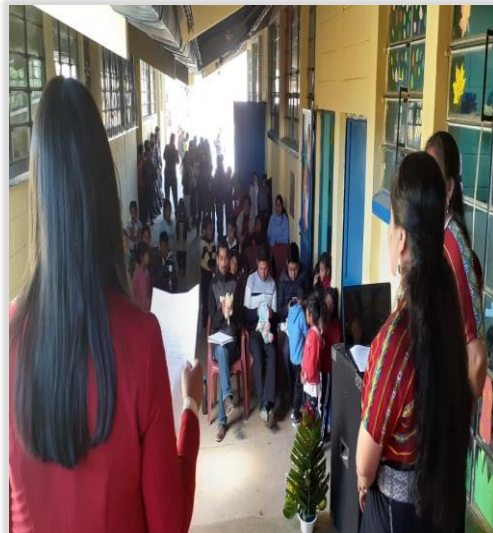
Figura 16. Explicación de Metodología a trabajar en el PME