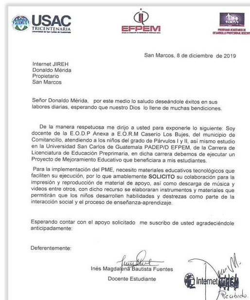
Figura 6. Solicitud a Internet Jireh.