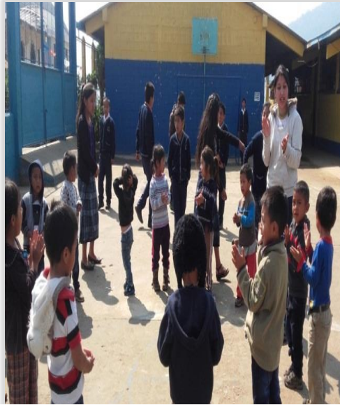
Figura 21. Juegos de Interacción social

Algunas de las estrategias realizadas fueron muy efectivas con los niños logrando la participación en las actividades de interacción social dentro y fuera de clase con lectura de cuentos, juegos de interacción social con música y competencias entre otros.