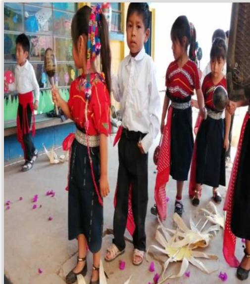
Figura 30. Niños participando en folklor en el acto cívico de párvulos.