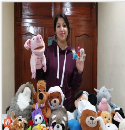
Figura 10. Preparación de Títeres y disfraces

Como última acción se diseñó y elaboro materiales kinestésicos, de teatro y danza tanto en la preparación, compra y elaboración de títeres, como de disfraces y material sensorial que se usaron en diversas actividades.