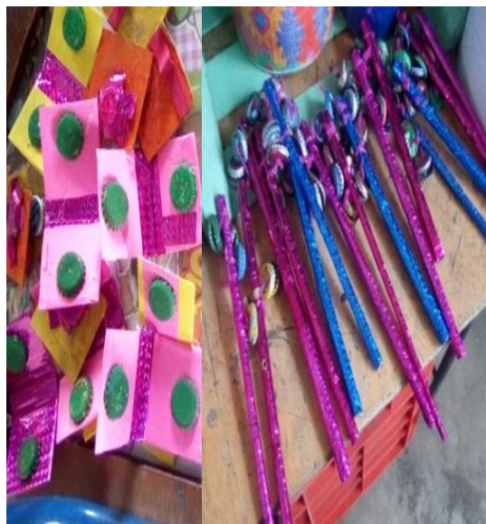
Figura 26. Material del Rincón de Expresión Artística elaborados en clase