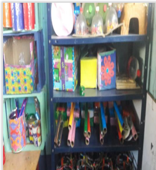
Figura 25. Materiales reciclados y del contexto del Rincón de Expresión Artística Fuente: Elaboración propia

Otra de las actividades realizadas en la fase de ejecución fue el enriquecimiento del rincón de expresión artística con materiales reciclados, naturales y didácticos del entorno, para desarrollar la discriminación auditiva en los niños.