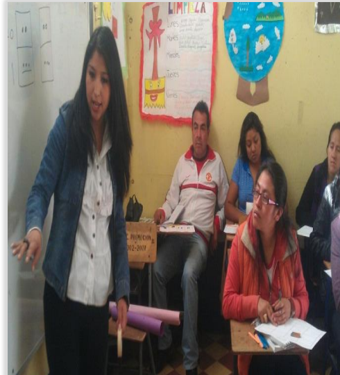
Figura 13. Capacitación a Docentes

También se realizaron capacitaciones a docentes del establecimiento sobre la importancia de la interacción social en el proceso de adaptación y la música como estrategia facilitadora del proceso de enseñanza en un constructivismo social.