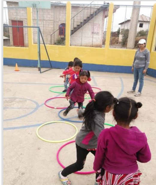
Figura 31. Niños participando en rallys para fortalecer el esquema corporal

Rallys y competencias con diversos materiales: ulas, conos, pelotas, cintas, entre otros. Así como la utilización de plastilinas, masas, pinturas, y materiales para sentir texturas y formas con diversas partes del cuerpo.