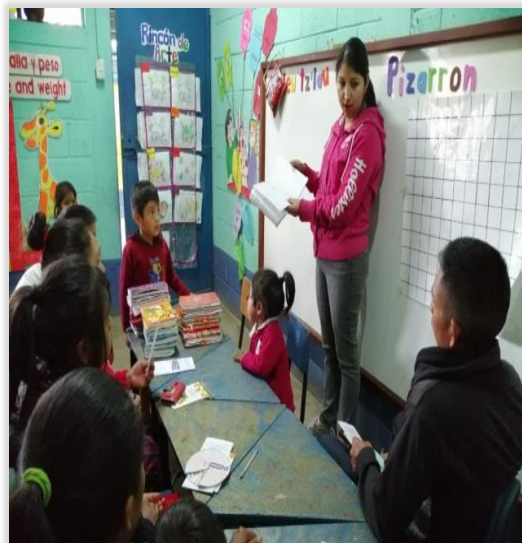
Figura 35. Socialización con padres de familia

Indicador De Contexto refleja el Índice de Desarrollo Humano en la dimensión básica de Educación salud en ingresos, tomando como base la educación que en la situación inicial se detectó en la falta de cobertura educativa debido a padres de familia desinteresados en la educación del nivel inicial y preprimario de sus hijos, el resultado esperado es el avance de la calidad educativa por medio de las estrategias utilizadas y el involucramiento de padres de familia en el proceso educativo para impulsar las actividades del nivel y garantizar el mejoramiento en un 90% de la calidad educativa y la promoción del nivel preprimario.