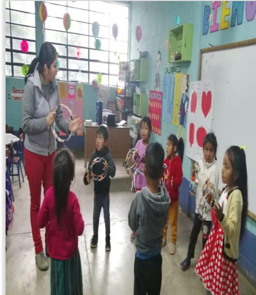
Figura 29. Niños cantando haciendo uso de panderetas para desarrollar interacción social.

Dentro de las actividades programadas del establecimiento están los actos cívicos que semanalmente se realizan a cargo de cada grado iniciando desde párvulos hasta sexto primaria, así como también actividades conmemorativas por fechas educativas o comunales en las cuales los niños de párvulos tienen la oportunidad de participar demostrando el aprendizaje de interacción y socialización alcanzados en el aula.