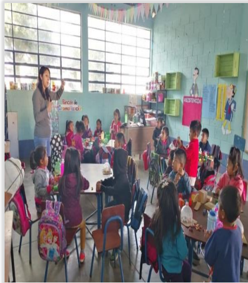
Figura 33. Asistencia Constante de Niños

El indicador de proceso está caracterizado por la organización de la estructura de enseñanza aprendizaje, estando entre los más relevantes la Asistencia de alumnos, la disponibilidad de Textos y Materiales por parte del docente, en el establecimiento la situación inicial de este indicador fue relevante en cuanto a la asistencia de niños la cual era irregular, 4 de cada 10 niños acuden a la escuela discontinuamente, era evidente la escases de material didáctico adecuados para desarrollar estrategias novedosas, así como el poco involucramiento de padres de familia en actividades escolares por falta de interés y destrezas de interacción social.