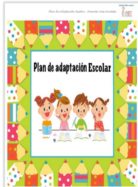
Figura 4. Plan de Adaptación Escolar