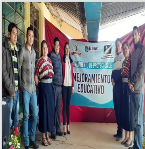
Figura 14. Lanzamiento del Proyecto con la participación de la comunidad educativa

La presentación del Proyecto a la comunidad Educativa se realizó en el establecimiento con el Lanzamiento del Proyecto a través de la Socialización del PME sobre interacción social con música con autoridades Educativas, directora, personal docente y algunas autoridades comunitarias.