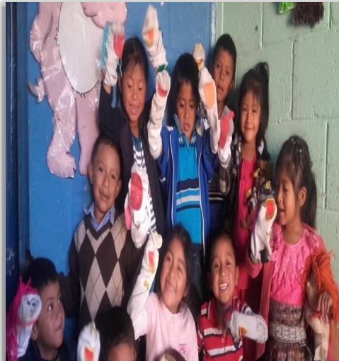
Figura 23. Teatro de Títeres de mano

Dentro de las Actividades Aleatorias a realizar tanto en la etapa de adaptación con en el proceso formativo están los Audio cuentos, Juegos y rondas, Motricidad Específica, Ejercicios Grafo motrices, Teatro de Títeres de mano y digitales, entre otros.