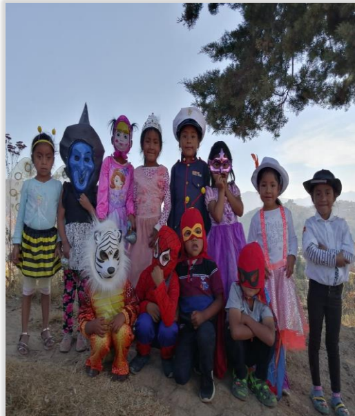
Figura 27. Niños Disfrazados con materiales del rincón de Expresión Artística

Se Organizaron materiales para disfraces, teatro y danza para realizar un baúl con materiales afines a la dramatización, todo esto está incluido también en el rincón de expresión artística, para desarrollar en los niños habilidades escénicas y expresivas al momento de cantar, jugar y bailar con los instrumentos en clase o en actividades del establecimiento.