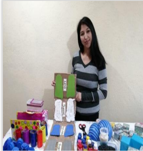
Figura 9. Elaboración de Materiales sensoriales y técnicas novedosas.

Como parte de la planificación se recopilaron actividades con técnicas y estrategias novedosas la cual está estructurada por el plan de actividades de interacción social con música que se realizó en el Periodo de Adaptación, se descargó un listado de música mindfulness y musicoterapia, videos de cuentos, juegos, historias cortas y normas de cortesía e higiene que sirvieron cada día en las actividades programadas, también se elaboraron materiales sensoriales que posteriormente se utilizaron en el proceso de aprendizaje.