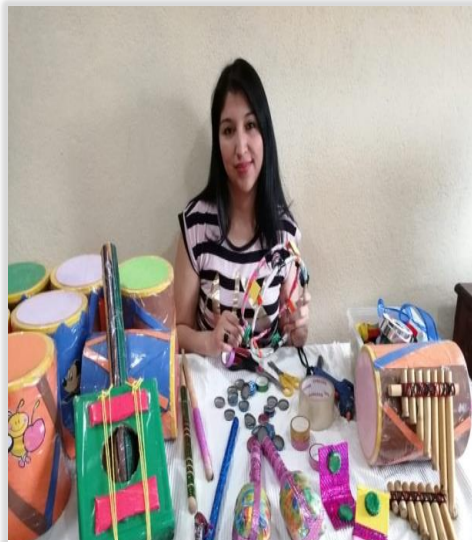
Figura 7. Elaboración de Instrumentos Musicales, con material reciclado.

Esta fase orienta las acciones que se llevarán a cabo en el proyecto, su calendarización y los objetivos que se quieren conseguir en virtud de los recursos obtenidos durante la fase de inicio. En primera instancia se obtuvo la estructura y elaboración de instrumentos musicales para el rincón de expresión artística en la sub área de educación musical, con materiales del entorno natural, reciclados y del contexto.