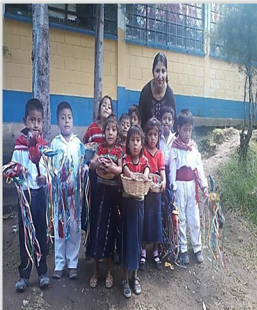
Figura 36. Participación Folk lorica en el establecimiento educativo.

Se logró con mucha satisfacción el objetivo propuesto y fue sorprendente la trascendencia del proyecto que tuvo con los niños del nivel primario por ser una escuela anexa, tuvo gran impacto con los padres de familia y la comunidad educativa quienes comentaron los resultados favorables en el aprendizaje social y emocional de los niños lo cual fue evidente en las características de la personalidad de cada uno y en las participaciones a nivel del establecimiento.