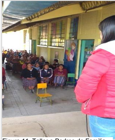
Figura 11. Taller a Padres de Familia sobre interacción social en preprimaria

En esta fase se detallaron todas las actividades, tareas y sub tareas que se necesitaron para ejecutar el proyecto en el tiempo establecido dentro del contexto educativo. Inicialmente se estructuro un plan de talleres, capacitaciones y actividades organizadas con acciones a seguir en el transcurso del PME, se dio a conocer un taller a padres de familia sobre la importancia de la interacción social en la escuela desde la más temprana edad desde los 4 años hasta los 6 años y 6 meses antes de iniciar el nivel primario.