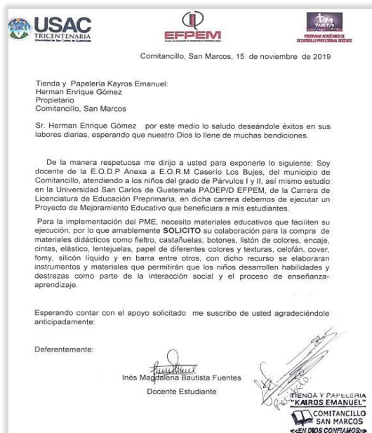
Figura 5. Solicitud a Librería Kairos Emanuel del municipio de Comitancillo.

Se realizaron gestiones a empresas, comercios, librerías y centros de internet buscando obtener apoyo en recursos didácticos o económicos, para la elaboración de materiales que servirían en el desarrollo del proceso educativo y la ejecución del proyecto, con anterioridad se elaboró un presupuesto que sirvió de referencia en la obtención de gastos y recursos a utilizar para posteriormente diseñar y estructurar los materiales didácticos ya planificados.