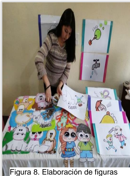
Figura 8. Elaboración de figuras

Así como también se elaboraron diseños de figuras de sonidos vocálicos, onomatopéyicos, y lectura de imágenes.