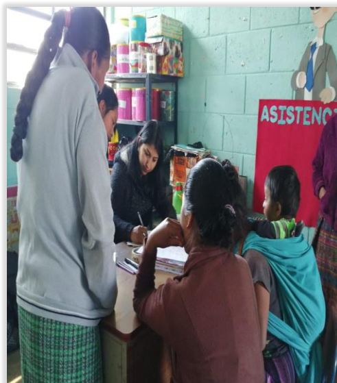
Figura 20. Llenado de Ficha Psicopedagógica

La Integración de los padres de familia en actividades introductorias y en el llenado de información de la ficha psicopedagógica es muy importante en el inicio de clases para conocer datos relevantes de los estudiantes y obtener un acercamiento con su entorno familiar y social.