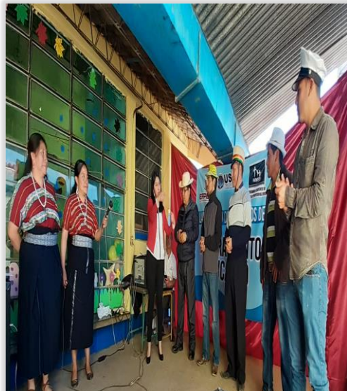
Figura 18. Participación de Autoridades en juego de sombreros con musicoterapia.