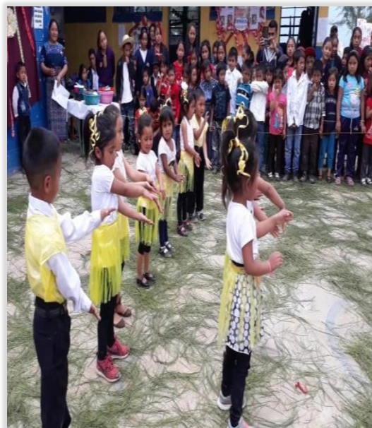
Figura 37. Comunidad Educativa observando participar a los niños de párvulos.