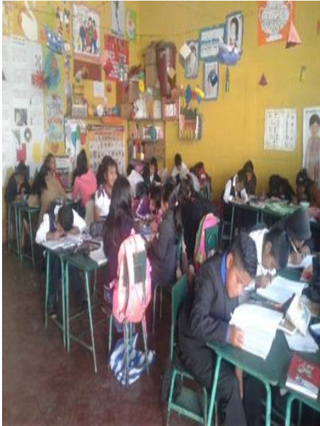
Ejecucion del PME dentro del aula de quinto grado sección "A" 32 estudiantes