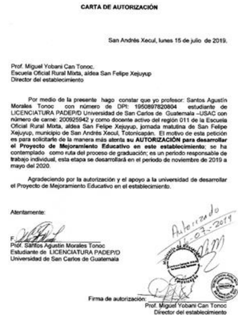
Firma de carta de autorización del PME por el director y Coordinadora Educativa