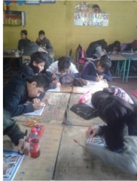
Desarrollo de habilidad lingüística de escribiendo el idioma k'iche' dentro del aula