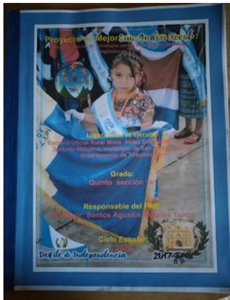
Portada del manual de apoyo PME