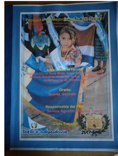
Manual de apoyo del PME