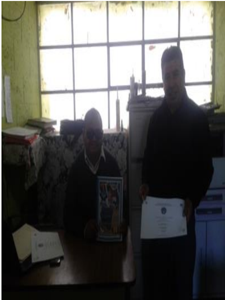
Presentación de plan y manual de apoyo del PME al director