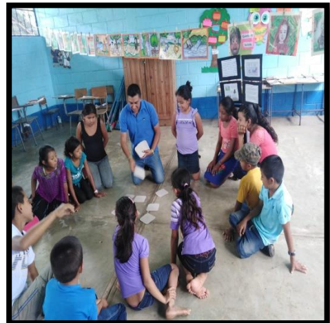
Foto: 15 Actividades lúdicas Cartillas de sinónimos.

El juego en el aprendizaje es un papel principal ya que la nueva metodología requiere que los niños aprendan jugando, es por eso que se dirigen juegos de mesa de la cartillas de sinónimos y antónimos, rompecabezas, loterías para poner en práctica, la comprensión lectora, el estudiante busquen en el diccionario el significados de las palabras que recuerdan al jugar con las