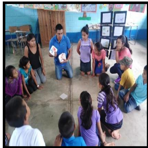
Foto 21 Galería de lectura.

Es una actividad que permite a los estudiantes transmitir y recibir información a través de la lectura, convirtiendo un medio de expresión y desarrollando la creatividad organizando los libros, revistas, periódicos, portafolio elaborados por los estudiantes, imágenes, trabajos manuales, dibujos y otros que formen parte de la lectura, fortaleciendo el indicador de resultado de lectura ya que los estudiantes tienen la capacidad de comprender lo que lee.