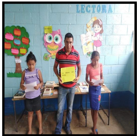
Foto No. 19 Velocidad de lectura al compás del Reloj.

facilidad para la retención lectora concentración y atención de los niños.