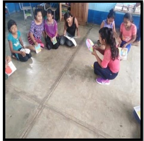
Foto.12 práctica de lectura en pareja

opiniones y comentarios transformando la educación inclusiva respetando su identidad ya que todos somos capaces de construir los conocimientos.