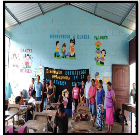
Foto 10 Taller a Madres de Familia.

Se dirigió el taller sobre la importancia de la comprensión lectora en el nivel primario, para concientizar a los padres de familias que apoyen a sus hijos e hijas a crear espacios de lectura para que ellos puedan realizar resúmenes y expongan ante los demás los conocimientos adquiridos.