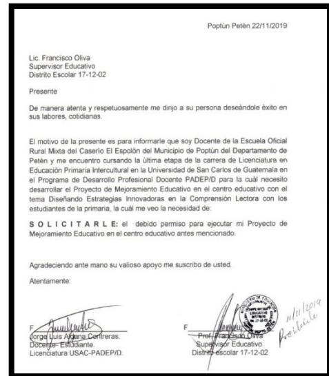
Foto 1. Entrega de solicitud al Supervisor Educativo.