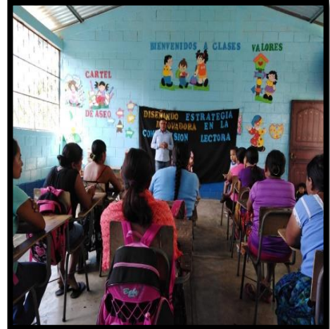
Foto No.8 Lanzamiento del proyecto

Se da la bienvenida a todos los presentes y se explica que el proyecto es parte fundamental del proceso de Graduación de Licenciatura del nivel Primario por parte de la USAC-PADEP/P con el objetivo de transformar la educación y los estudiantes aprendan a desarrollar habilidades lectoras.