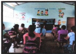
Lanzamiento del proyecto