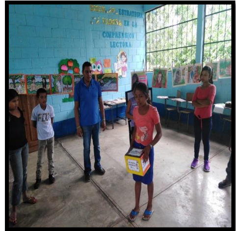
Foto: 14 Dado de la comprensión lectora.

imaginación creadora en los niños y niñas, estimula la producción de textos por medio de resúmenes, portafolio describiendo lo que comprende después de leer. Los estudiantes se motivaron y participaron activamente ya que los aprendizajes son significativos.