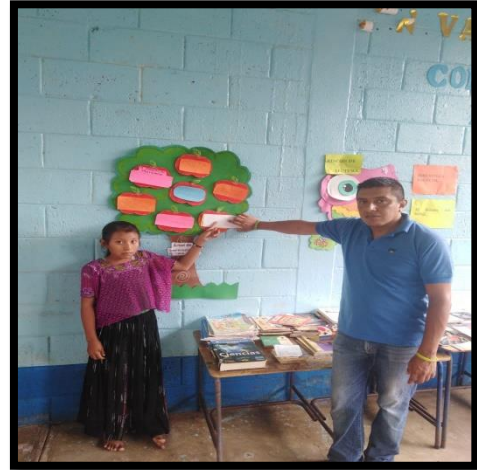
Foto 20 Árbol de la comprensión lectora.

innovadores facilitando los conocimientos con el acompañamiento por parte del docente y con el apoyo de los actores que intervienen en el proyecto de Mejoramiento educativo.