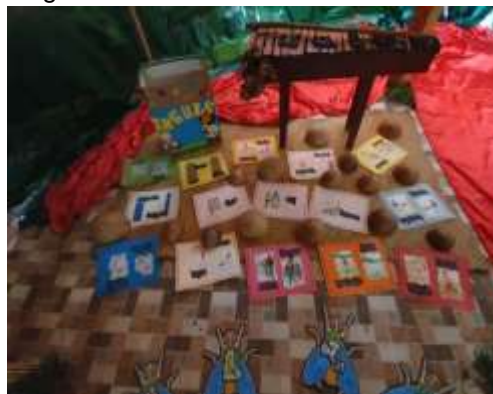
Fotografía 2 Fotos de divulgación