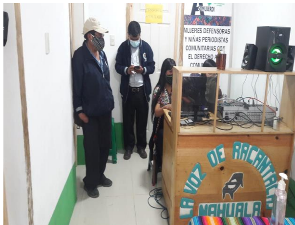
Imagen No. 3 Presentación y divulgación PME