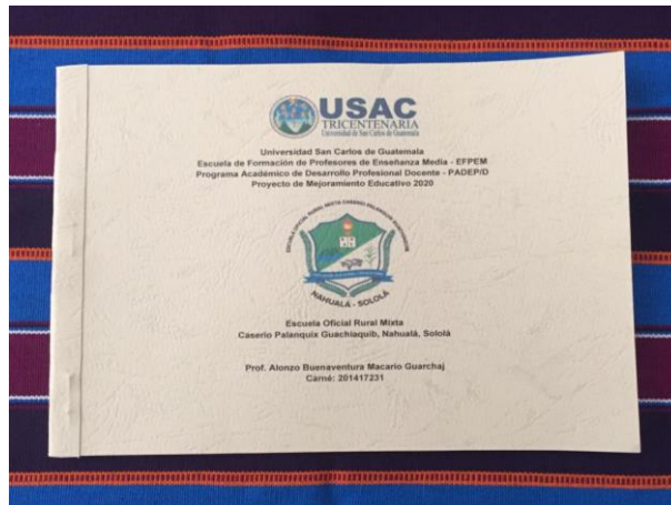
Imagen No. 5 Manual de juegos tradicionales