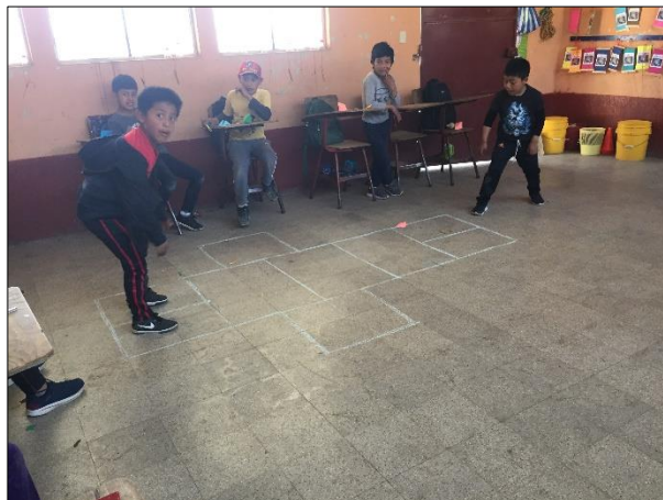
Imagen No. 8 Juego del avioncito