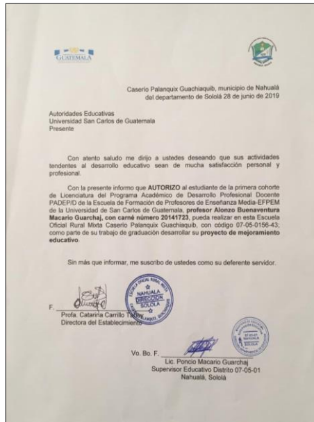
Imagen No. 4 Autorización de ejecución PME