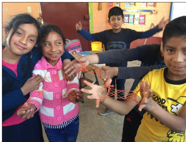
Imagen No. 7 Juego formando figuras con cuerda o pita