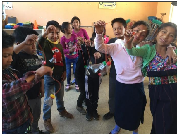
Imagen No. 6 Juego del capirucho