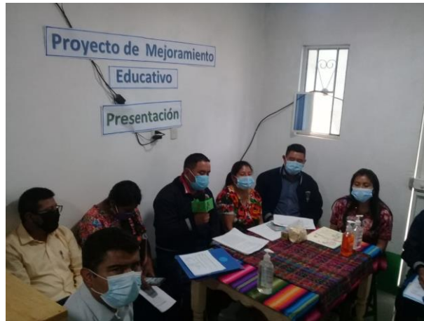
Imagen No. 2 Presentación y divulgación PME