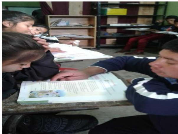
Imagen 3 Evaluación

Análisis durante la ejecución de las actividades realizado con los estudiantes de quinto primaria, se logró mejorar la interpretación de los textos, el uso adecuado del diccionario.