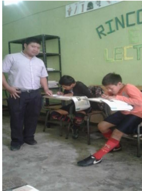
Imagen 1 Fase de inicio