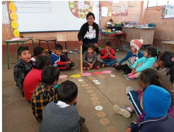
Imagen No.3 Clasificando y mencionando las grafías

Fase No. 3 Tipos y clasificación de las grafías del idioma k'iche': vocales, simples, compuestas, simples glotalizadas y compuestas glotalizadas, desarrollado en diez horas de fecha quince al veintiuno de enero de 2020, Con la participación de los estudiantes con el uso del mapa de clasificación como estrategia de aprendizaje, con el conocimiento previo y nuevos conocimiento en relación al contenido; monitoreando la tarea constantemente para el logro de un aprendizaje significativo.