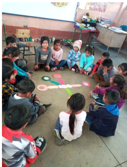
Imagen No. 2 Clasificando grafías

Fase No. 2. Características de las grafías del idioma k'iche'. Vocalicos, consonánticos, simples, simples glotalizadas, compuestas y compuestas glotalizadas, desarrollado en dos horas de fecha catorce de enero de 2020. Con el uso de mapa de burbujas con la participación activa de los estudiantes dando sus ideas, el rendimiento académico de los estudiantes fue aceptable según el monitoreo realizado.