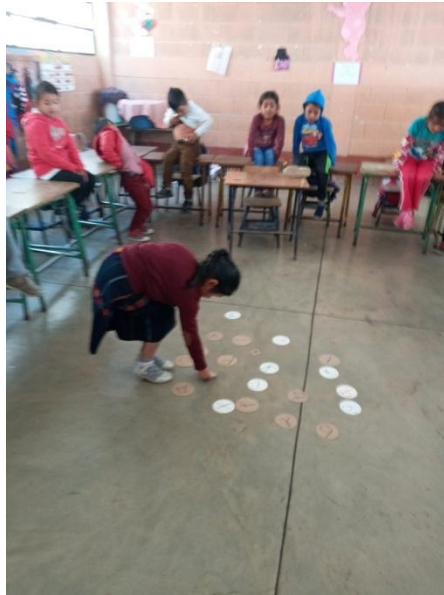
Imagen No. 7 Formando palabras en el idioma K'iche'

T'ot', t'u'y, t'u'n, t'us, t'enom, t'isom