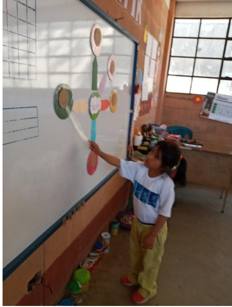
Imagen No.5 Señalando las vocales abiertas y cerradas