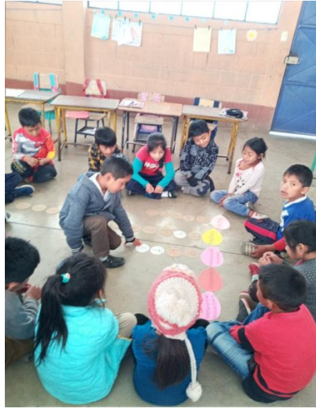
Imagen No. 4 Pegando las diferencias de las grafías