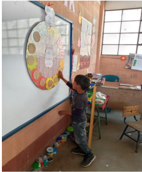
Imagen No. 1 Estudiante pegando grafías