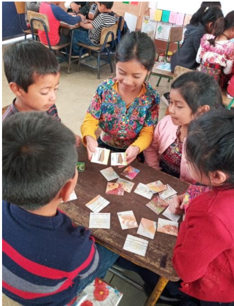
Imagen No. 6 Practicando juego de memoria