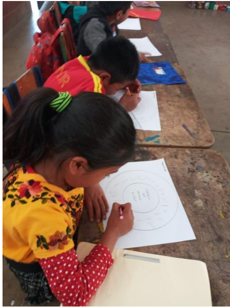
Imagen No. 7 Escribiendo las grafías en el mapa circular