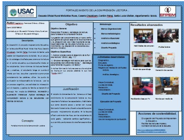
Imagen No. 6 Póster académico.