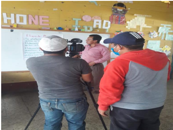
Imagen No. 1 Divulgación del proyecto