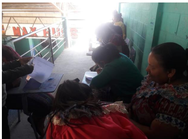
Imagen No. 2 Encuesta a padres de familia

La presentación y aceptación del proyecto, la participación de los padres de familia en la encuesta, y la coordinación con el director de la escuela y personal docente, comisión de lectura. Autorización en la ejecución del Proyecto Mejoramiento educativo, en la Escuela Oficial Rural Mixta Max Russ. Se proceda en la ejecución con la participación de los estudiantes.