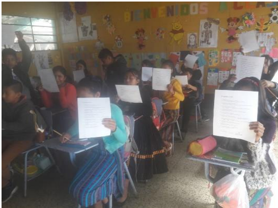
Imagen No. 4 Interpretación de lectura