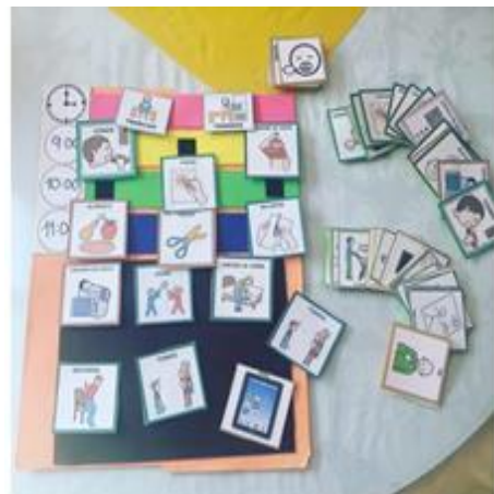
Fotografía No. 8 Estrategia Tarjetas Flash Card

Cada fase se desarrolló y ejecutó cada actividad; siendo ésta importante; por la aplicación de las herramientas para los alumnos que presentan barreras en en el