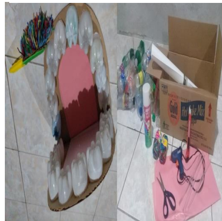
Fotografía No. 10 Estrategia "Mis dientes sonrientes"