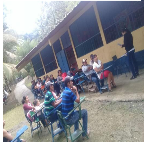
Fotografía No. 5 Reunión con padres de familia

En ésta fase se realiza las siguientes actividades: Gestión de material para la