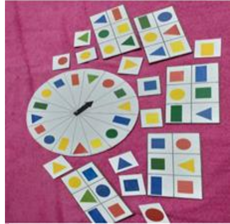
Fotografía No. 7 Estrategia "Arremete la Ruleta"

La primera semana de enero del año 2020 se lleva a cabo la reunión con la directora del establecimiento y personal docente para la inducción de elaboración del material para los alumnos que presentan barreras en el aprendizaje; Así mismo la elaboración de las estrategias de enseñanza por medio de material didáctico para los alumnos de Párvulos; abarca desde la segunda semana hasta la tercera semana de enero.