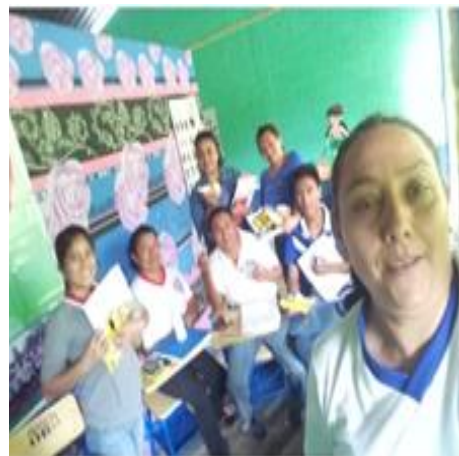
Fotografía No. 6 Reunión Personal Docente, Inducción Elaboración de Material Didáctico