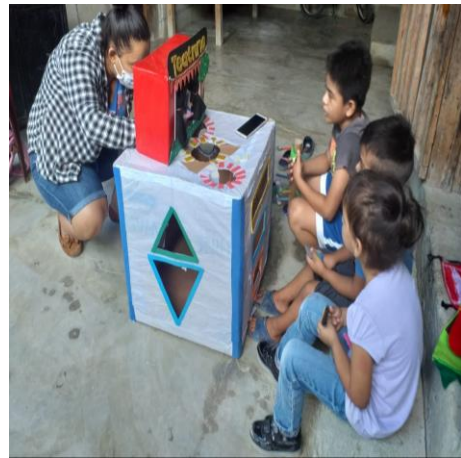
Fotografía No. 9 Aplicando las estrategias "El Teatrino" docente y tres niños discapacidad Intelectual

Entrega del material didáctico a la directora con etapas 4, 5, y 6 preprimaria se planificó hacer la entrega del material, se completó esta actividad; por lo mismo, la evaluación de la fase se alcanzó a desarrollar, siendo satisfactoria.