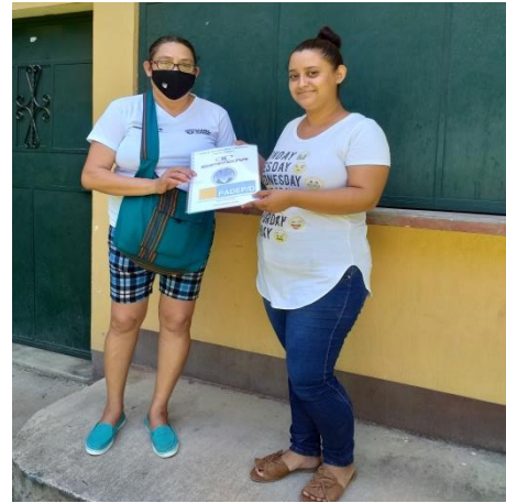
Fotografía No. 12. Entrega del Manual de Estrategias a la Directora y docente de la EODPEE

Como todas las fases fueron importantes