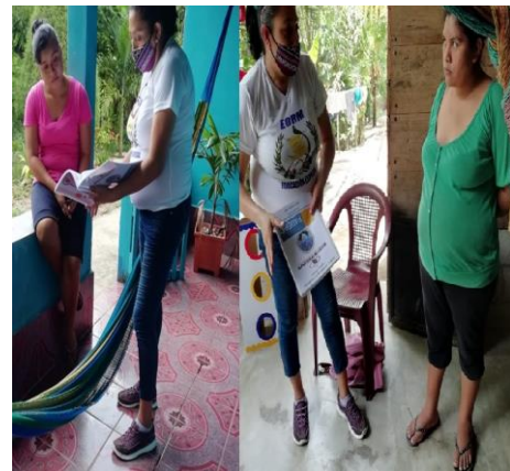
Fotografía No. 13. Visita a madres de familia Divulgación del PME

Además se da el desarrollo del plan de Divulgación y se compartió con los padres de familia, autoridades educativas y demás actores el cierre del Proyecto de Mejoramiento Educativo, que lleva como tema “Implementar estrategias para niños que presentan barreras en el aprendizaje”. Y, por último realizaron la evaluación final; ésta engloba todo el diseño del proyecto, evidenciando los resultados esperados, siendo estos en un 70% alcanzados y en un 30% no esperados; por tanto, se informa a donde corresponde para su análisis y aprobación, dado el cierre de dicho proyecto.