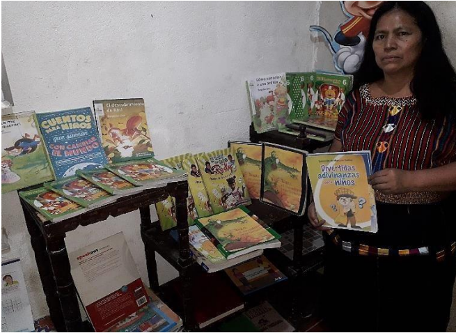
Fotografía No. 12