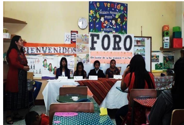
Fotografía No. 9