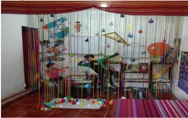
Fotografía No. 10