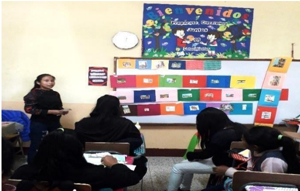
Fotografía No. 8