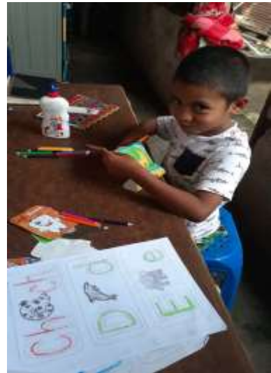
Fotografía 2, El estudiante de Primero B, elaborando su memoria y sus hojas de trabajo del abecedario.