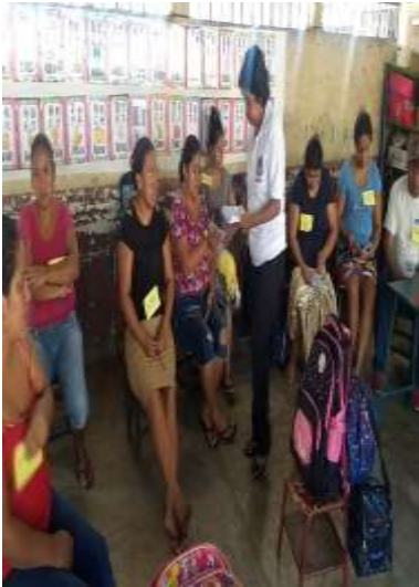
Fotografía 6, La docente entregando el trifoliar del Proyecto de Mejoramiento Educativo.