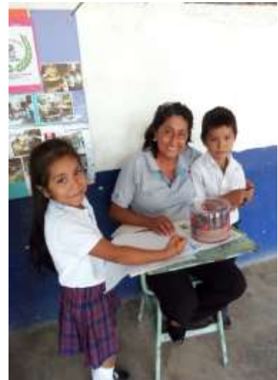
Fotografía 7, La docente tomando Comprensión de Lectura, con los estudiantes de Primero "B".