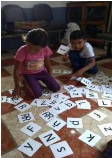
Fotografía 12, Los estudiantes de Primero "B" seleccionando su abecedario.