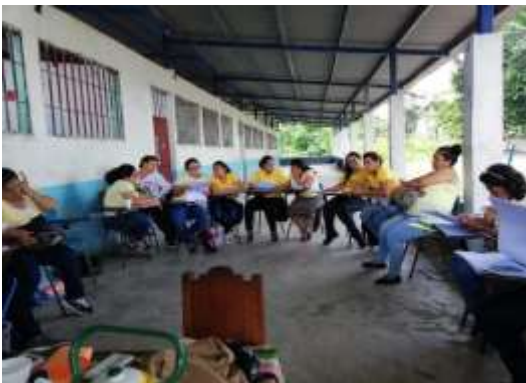
Fotografía 8, Capacitación a Docentes, con el tema Estrategias de Lectura.