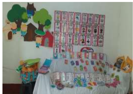
Fotografía 9, La docente Rosa Hidalgo presentando el material para el Rincón de Lectura.