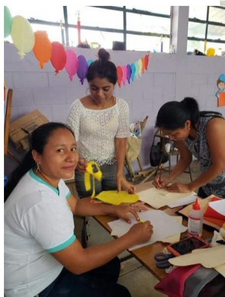
Fotografía 3 Elaboración de material y estrategias pedagógicas

En base a las actividades planificadas para la ejecución del proyecto, sufren variaciones en algunas actividades, debido a la situación que se