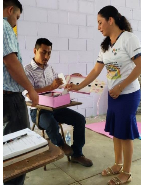
Fotografía 4 Taller de estrategias pedagógicas

Para el desarrollo de esta actividad se hizo un plan para ordenar las actividades que se realizaron en el taller de estrategias a docentes; llevando una secuencia lógica de cada una de las actividades, luego se realizó convocatoria a los docentes para asistir al taller invitando al Coordinador Distrital y Asesor pedagógico de SINAIE para realizar el desarrollo del taller en la escuela, se recolectaron materiales para utilizar de apoyo en el taller