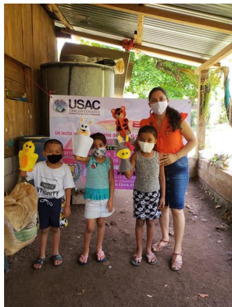
Fotografía 6 Visitas domiciliarias

Se tenía planificado realizarse así: Solicitar permiso a la profesora de primer grado para promover con los estudiantes las actividades de concurso de cuentacuentos, presentación de historietas con títeres y dramatizaciones, informar a los padres de familia de la actividad, realizar el concurso de cuenta cuentos, presentaciones de títeres, realizar presentaciones de dramatizaciones, elaborar bases para los concursos, hacer invitaciones