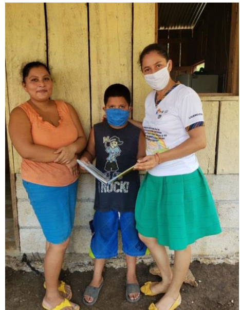
Fotografía 7 Monitoreando los cuentos con padres.

Resultado: Los estudiantes desarrollaron las actividades de manera voluntaria y participativa, practicando la lectura adquiriendo