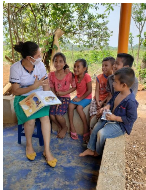
Fotografía 9 Desarrollo de monitoreo de las lecturas a niños.

Se realizaron Visita al aula de primer grado, se realizó observación en el aula para verificar el logro de los objetivos y se hizo confrontación sobre las estrategias propuestas