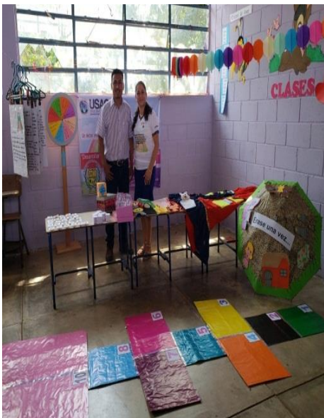
Fotografía 5 Docentes elaborando materiales didácticos para el desarrollo de las actividades.