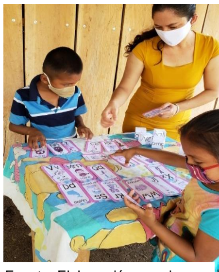
Fotografía 10 Proceso de evaluación a estudiantes por medio de visitas

Se realizó mediante la elaboración de una guía de observación para verificar a los docentes sobre la puesta en práctica de las estrategias recibidas en el taller, Utilización de una guía de observación para evaluar los concursos de cuenta cuentos y presentación de historietas con títeres., Observación directa para verificar el logro de la construcción de la ludoteca y el aula recurso, Entrega de informes periódicos a la Asesora