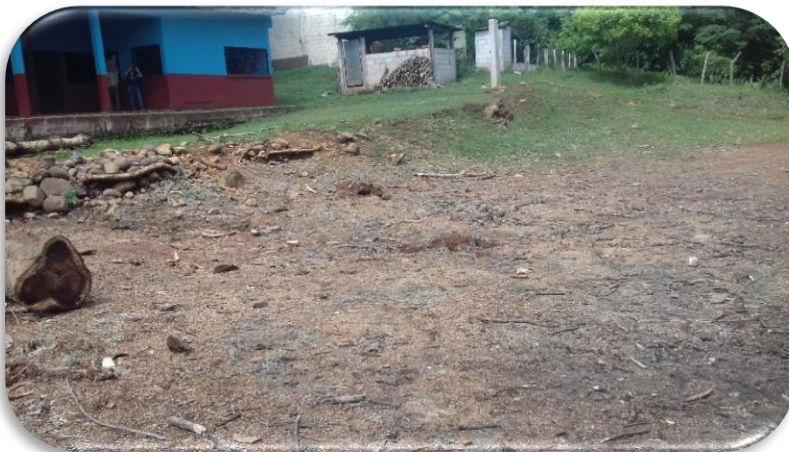
Ilustración 2. Antes de la ejecución del Ejercicio Profesional Supervisado. (Finca Los Ángeles) 2018