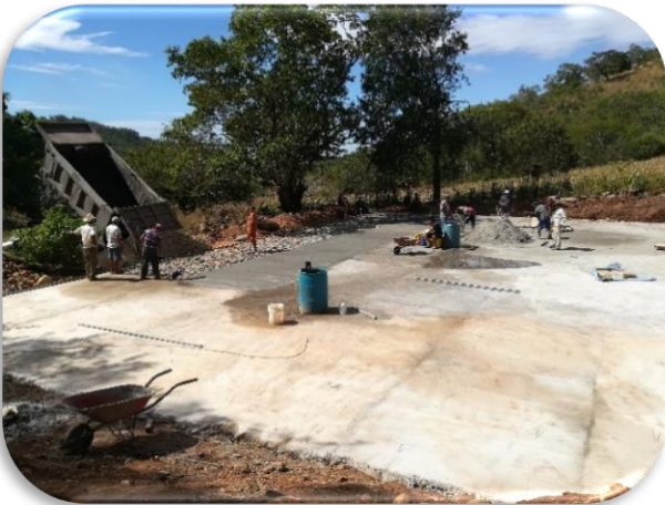
Ilustración 3. Durante de la ejecución del Ejercicio Profesional Supervisado. (Finca Los Ángeles) 2018 -2019