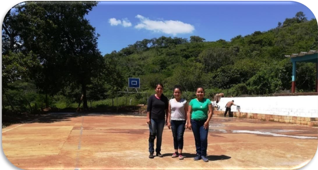
Ilustración 4. Finalización de la ejecución del Ejercicio Profesional Supervisado. (Finca Los Ángeles) 2019