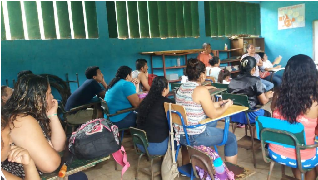
FOTOGRAFÍA No. 4. Durante la intervención del Voluntariado sobre el Rol de los padres de Familia de la Comunidad Educativa La Gavia, Oratorio, Santa Rosa (Finca Los Ángeles) 2017