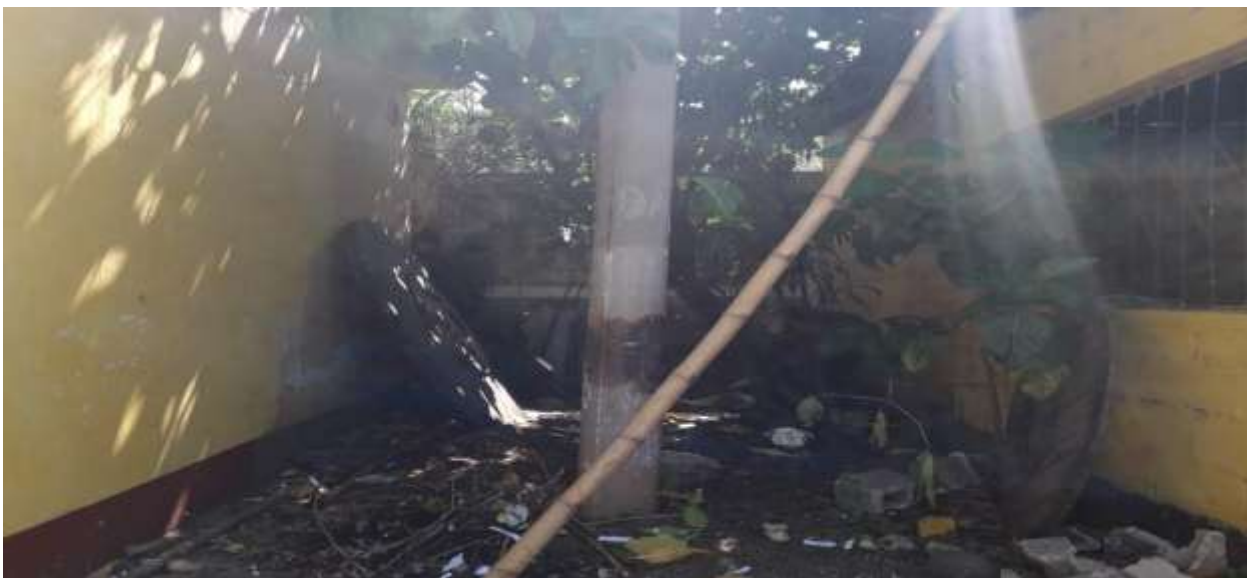
Figura 2. Limpieza de sitio previo a iniciar la intervención.