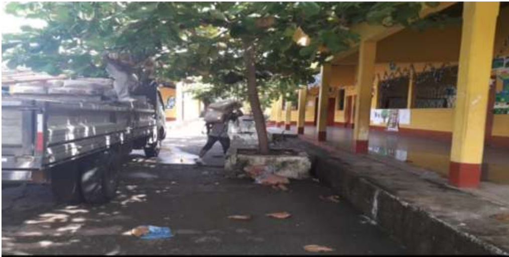
Figura 4. Inicio de la construcción de la bodega.