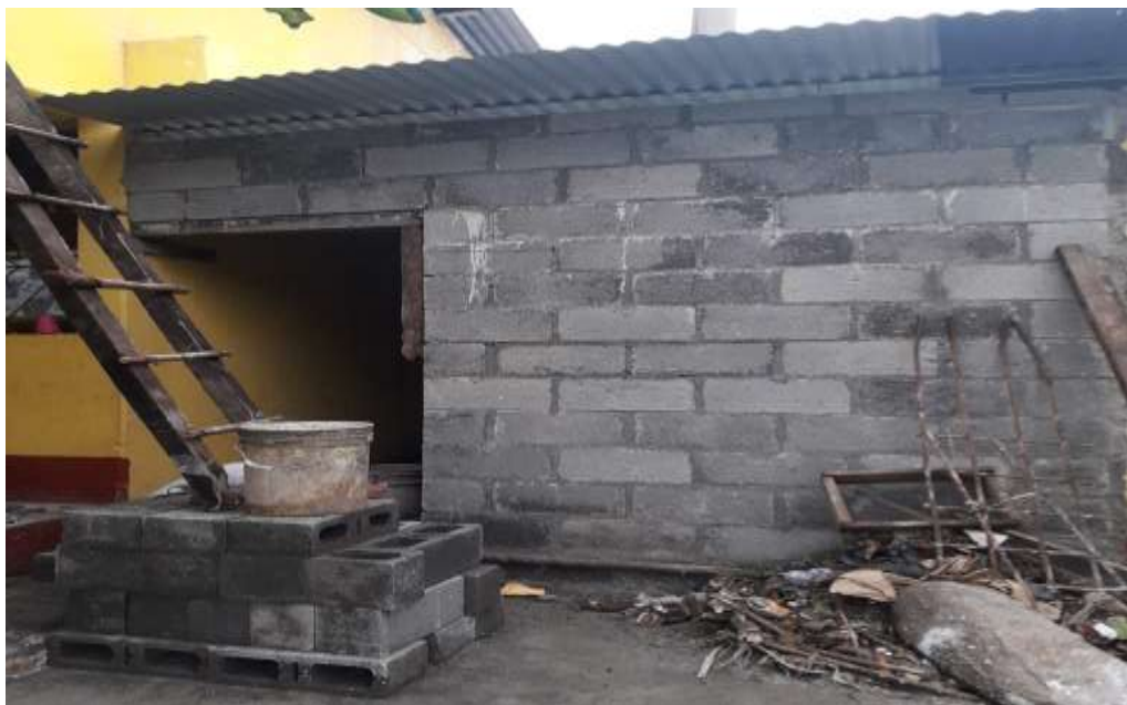
Figura 6. Mejoramiento del aspecto interno y externo de la bodega.