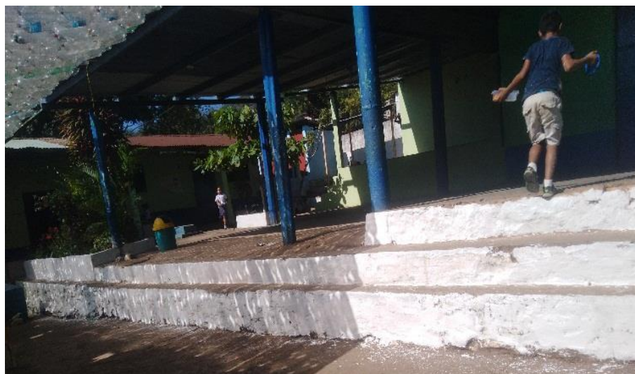
Figura 20. Gradas de acceso remozadas.

Nota: resultado final del voluntariado en las gradas.