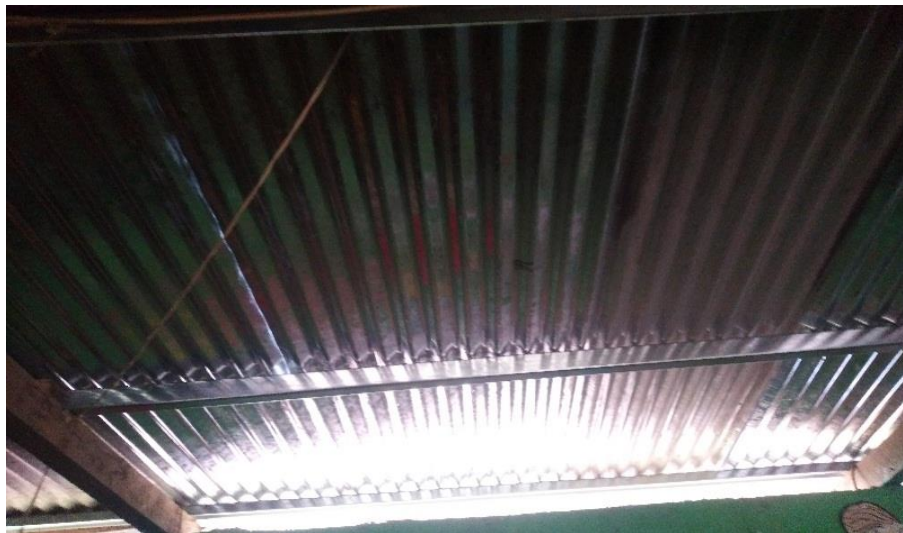
Figura 9. Costaneras y láminas nuevas

Nota: se aprecia que las vigas en mal estado fueron reemplazadas por costaneras metálicas galvanizadas.