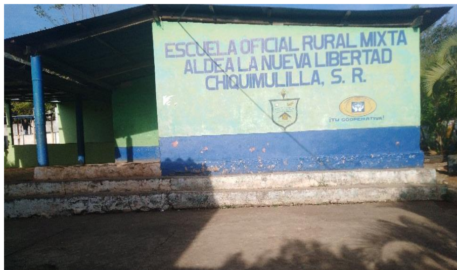
Figura 15. Gradas de acceso a los salones de clases

Nota: se muestra panorama de las gradas que conducen a los salones de clases antes de la intervención del voluntariado.