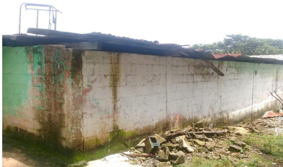
Figura 2. Parte trasera y techo deteriorados.

Nota: se observa el mal estado de las laminas y las manchas en la pared por el agua filtrada.