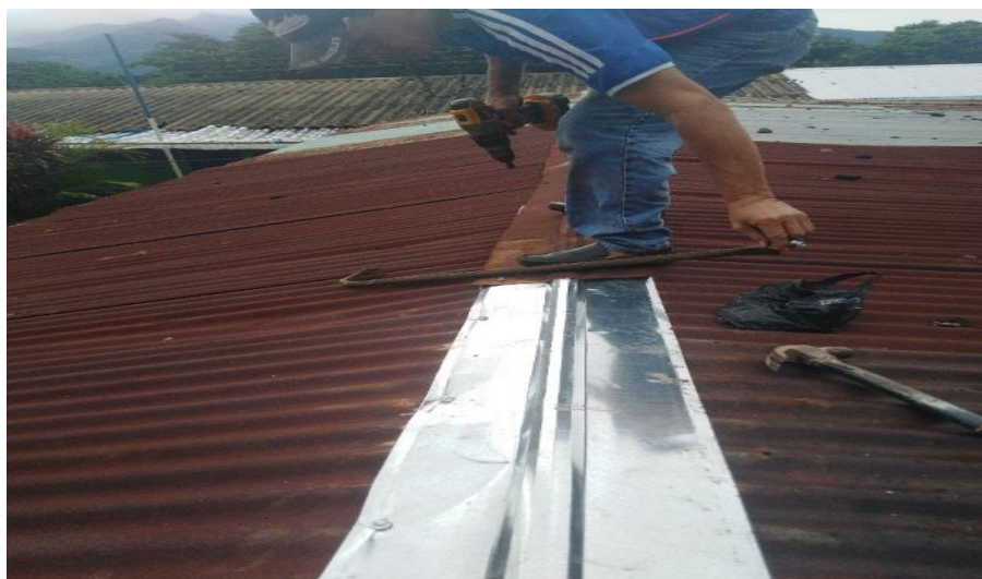
Figura 6. Cambio de capote.

Nota. Se cambio un de los capotes dañados del techo.