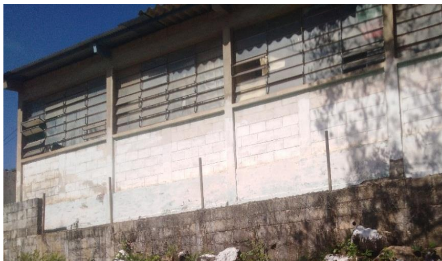
Figura 19. Parte trasera de la escuela remozada.

Nota: resultado de la intervención en la parte de atrás de la Escuela Oficial Rural Mixta aldea Nueva Libertad.