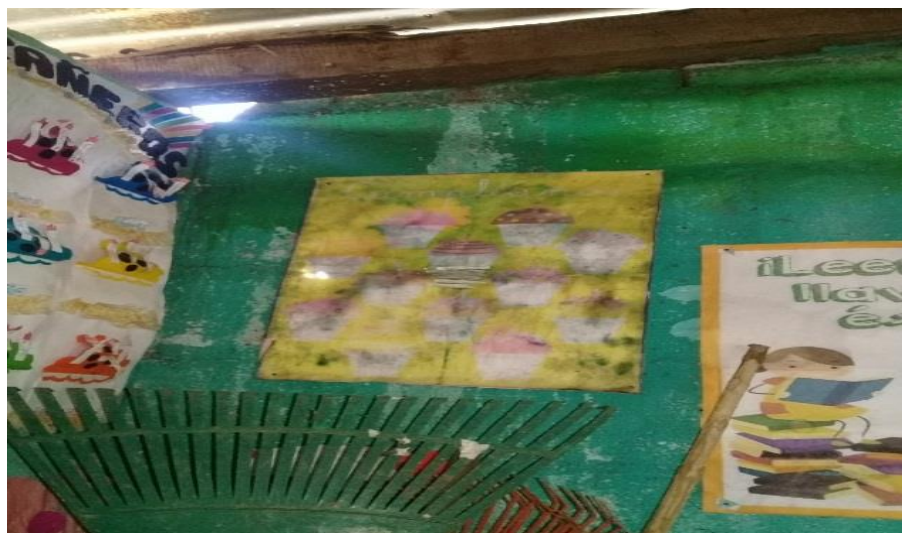
Figura 4. Material didáctico en mal estado por filtración de agua.

Nota: carteles y enseres de limpieza expuestos a filtración de agua.