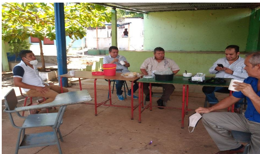
Figura 14. Refacción luego de la inauguración

Nota. Luego de realizar la entrega se procedió a entregar una refacción