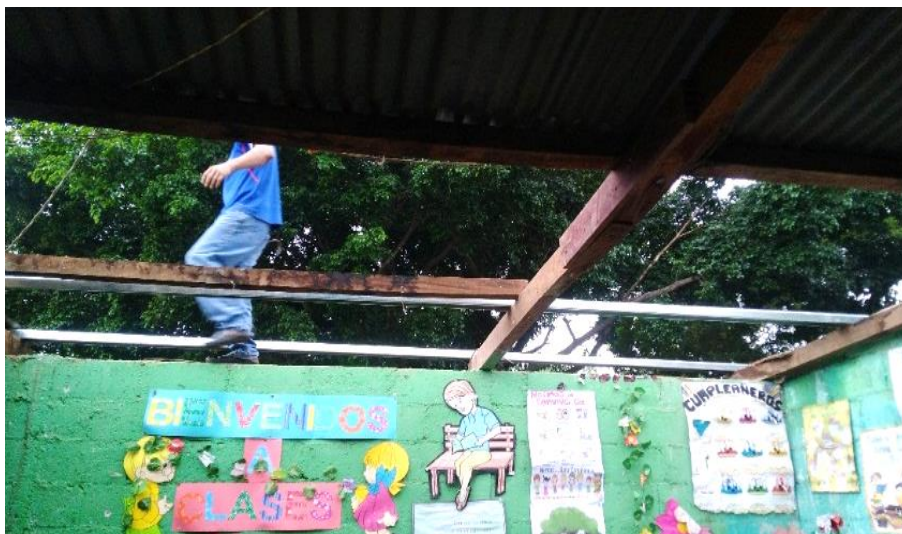
Figura 5. Desmantelamiento de infraestructura dañada.

Nota: primer día de la intervención (albañil quitando las vigas y láminas en mal estado y colocando las costaneras nuevas).