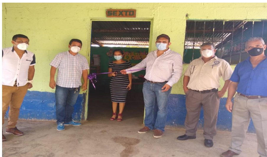
Figura 12. Acto de inauguración y entrega del proyecto.