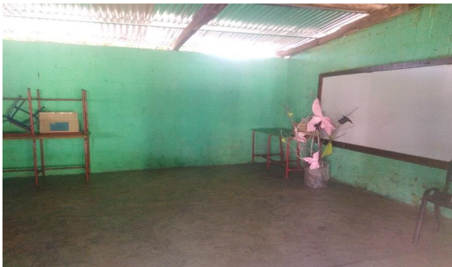
Figura 10. Paredes remozadas

Nota. Se embelleció el salón de clases con pintura nueva tanto dentro como fuera del salón de sexto primaria.