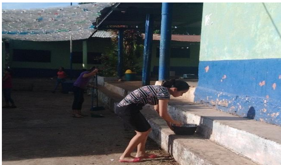
Figura 18. Participación de la estudiante del Centro Universitario de Santa Rosa.

Nota: se observa a la estudiante del Ejercicio Profesional Supervisado encalando las gradas.