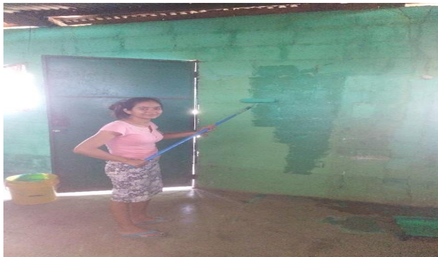
Figura 8. Aplicación de pintura en el interior del aula.

Nota: en el segundo día del proceso del proyecto se limpio y pintó las paredes del aula de sexto primaria.