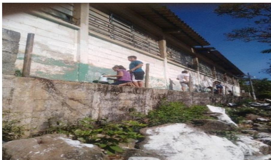
Figura 17. Participación voluntaria de alumnos.

Nota: se muestra el proceso, en el cual participan los niños.