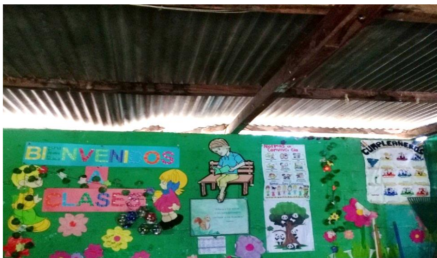
Figura 3. Vigas en mal estado

Nota: se observan las vigas en mal estado.