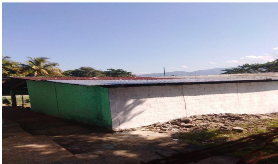
Figura 11. Remozamiento en pared trasera

Nota: Se aprecia el panorama embellecido que se ha dejado en dicho salón de la Escuela Oficial Rural Mixta en aldea Nueva Libertad.