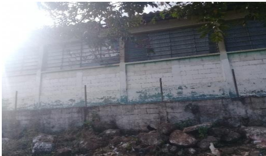
Figura 16. Parte de atrás de la escuela

Nota: se muestra una parte donde de las paredes que se encalaron en la Escuela Oficial Rural Mixta en aldea Nueva Libertad antes de la ejecución del voluntariado